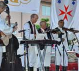
Financirat će se projekti koji najbolje promiču Ivanec

Grad Ivanec objavio je poziv svim ustanovama, KUD-ovima i udrugama da kandidiraju svoje projekte za financiranje iz Programa javnih potreba u kulturi i Programa javnih potreba u socijalno – humanitarnim djelatnostima za 2014. godinu.