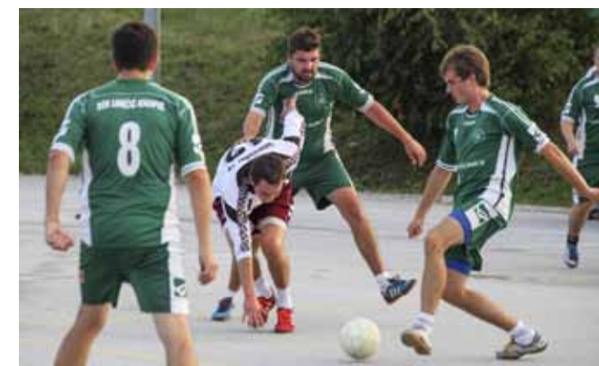
Ekipa DŠR-a Lancić – Knapić osvojila je drugo mjesto na 8. memorijalnom turniru

Na turniru je sudjelovalo deset momčadi. U susretu za treće mjesto Žarovnica I je sa 4:2 bila bolja od Vil Vula, dok je u finalnom susretu Žarovnica II sa 4:1 slavila protiv DŠR-a Lancić – Knapić.