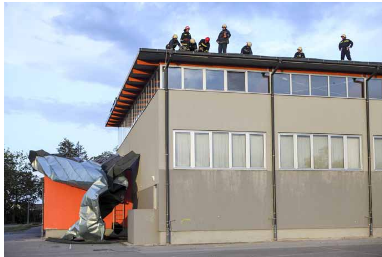
Olujni vjetar „namotao“ je 300 kvadrata krova na sportskoj dvorani Osnovne škole u Ivancu

NEVRIJEME Olujni vjetar pričinio je velike štete u Ivancu