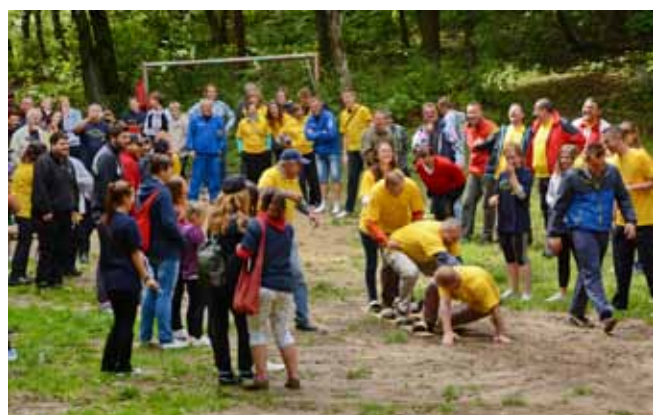
Druženje mladih na Ivančici