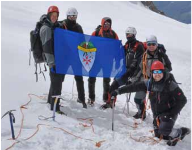
Ivanečki planinari na jednoj od najviših točaka stare Europe

Najteža dionica nalazila se pred samim domom, gdje je puhao olujni vjetar koji je uvelike otežavao vidljivost. Budući da je riječ o ekstremnim visinama, planinari se u domu nisu dugo zadržavali, zbog opasnosti od pojave simptoma visinske bolesti.