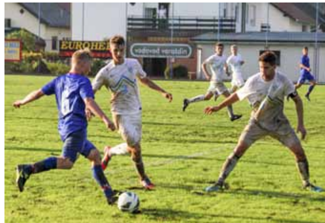
Međunarodna utakmicu kadetskih reprezentacija odigrana je na stadionu NK Ivančice