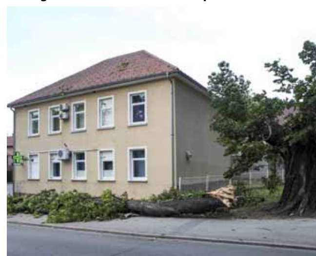
Sreća je što polomljena stabla i granje nisu nikoga ozlijedili