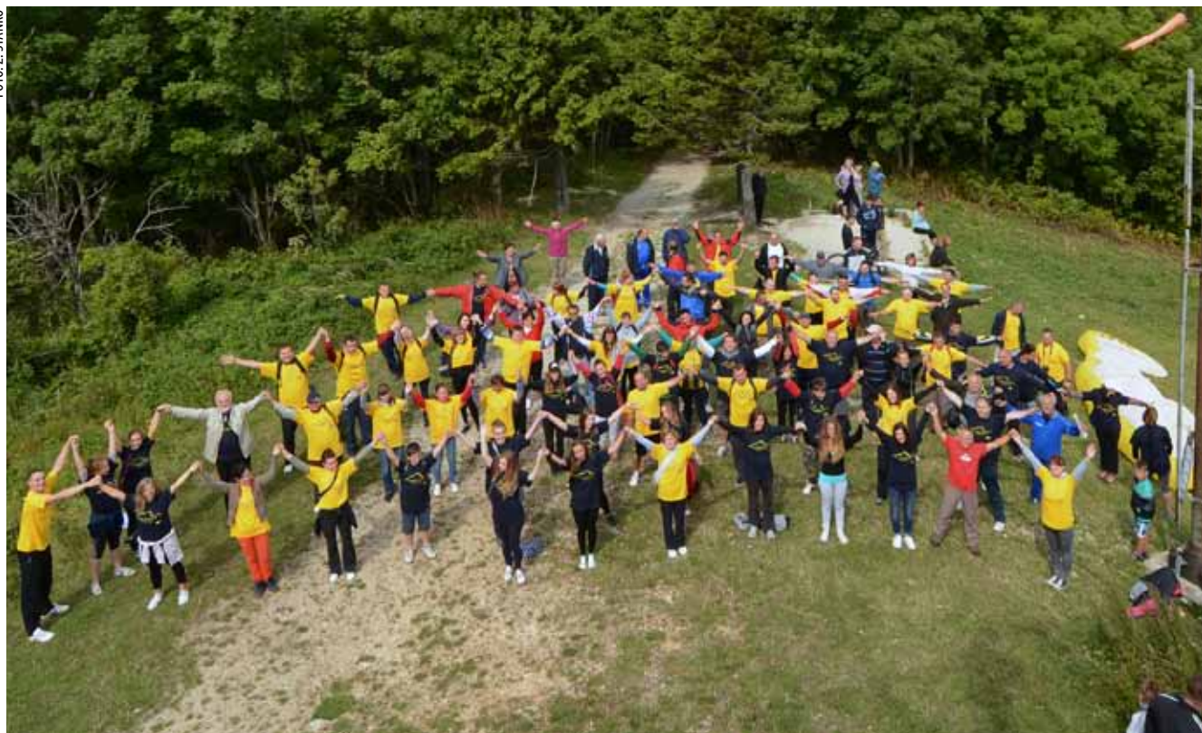
Suradnja je ovjekovječena milenijskom fotografijom na najvišoj planinskoj točki

NA DJELU Suradnja Zlatarske udruge mladih i Savjeta mladih Grada Ivanca