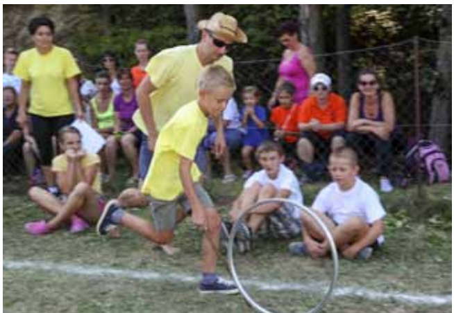
Guranje kotača nekad je bila nezaobilazna dječja igra