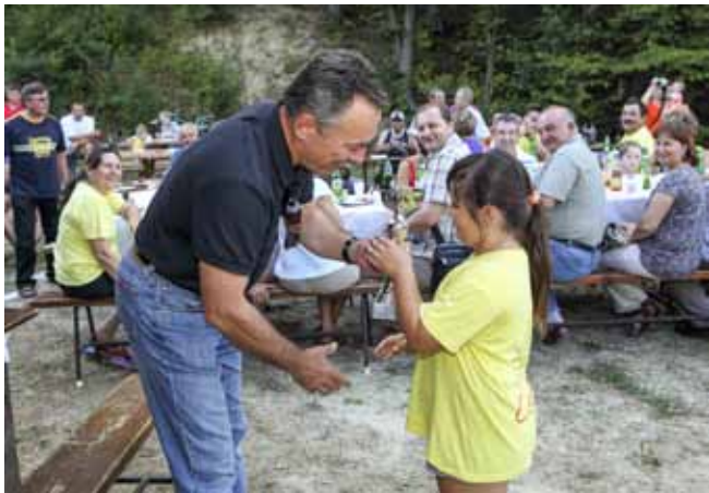
Na mladima svijet ostaje – pobjednički pehar primila je mala kapetanica Centra

I premda natjecanja nisu prolazila bez modrica, istegnuća, pa