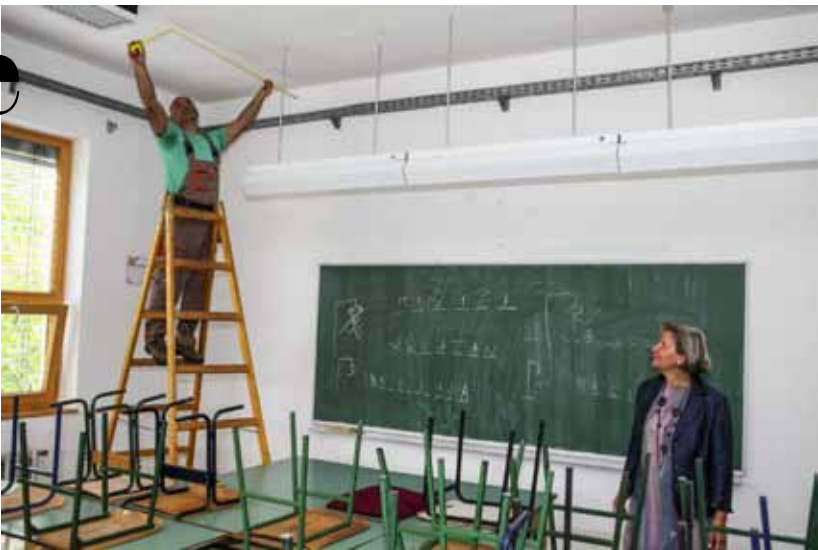
Pravodobno su obavljene pripreme za nesmetan početak nove školske godine

tatima. Svjedoči o tome podatak da su ispunjeni odjeli Gimnazije i Ekonomske škole, a popunjeni su i odjeli prodavača, stolara i strojara. U potpunosti je podbacio tek upis u tekstilni odjel, za kojeg interesa uopće nema, no to se povezuje s aktualnom situacijom i nesigurnim zapošljavanjem u tekstilnoj industriji. - U jednoj od učionica u suradnji s Agencijom za strukovno obrazovanje i s Konzumom uređujemo praktikum za buduće prodavače. Prostor će se opre-