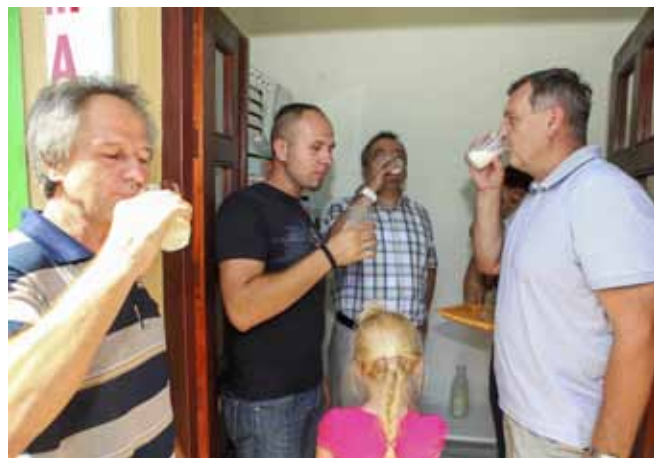
Ivančanima je na raspolaganju obrok zdravlja – kvalitetno domaće mljeko bez aditiva

Mljekomat je postavljen u zgradi Poljodoma u Ivancu, a mljeko se može kupiti svaki dan. (ljr)