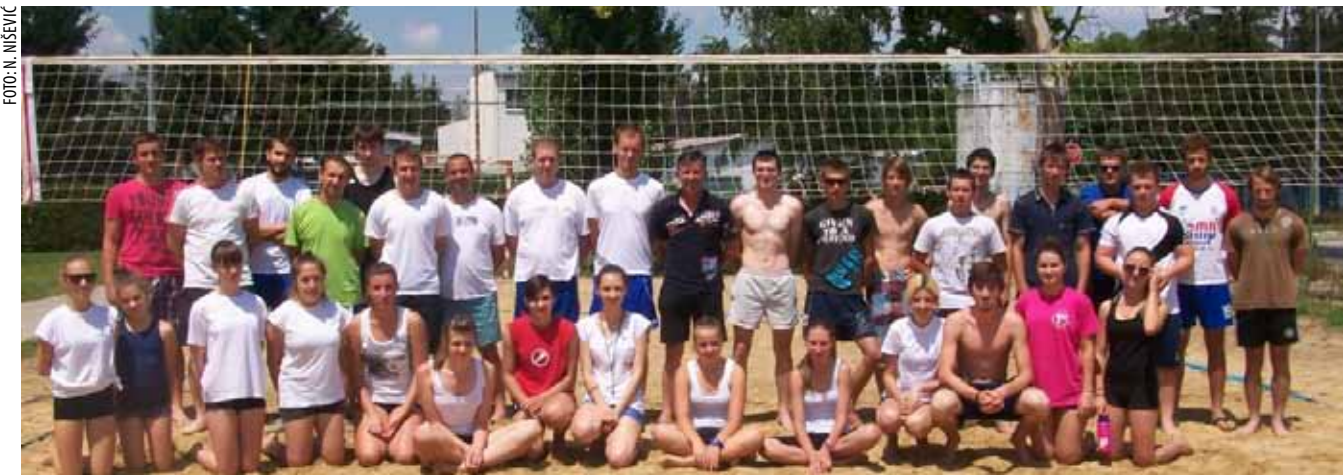
ODBOJKA NA PIJESKU Sudionici prvog turnira na pijesku na novouređenom odbojkaškom igralištu