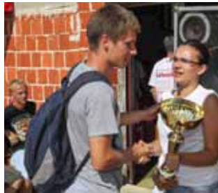
Pehari pobjedničkim ekipama