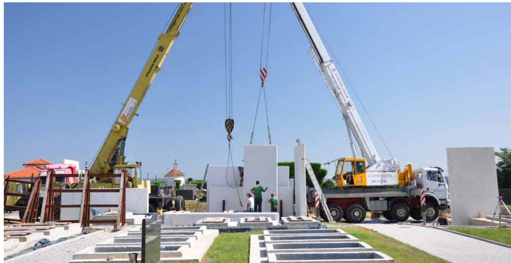
Groblje je ograđeno 75 metara dugom ogradom od betonskih panela

Nakon izgradnje komunalnih vodnih građevina, vlasnik je dužan priključiti se na njih u roku jedne godine od dana obavijesti javnog isporučitelja vodne usluge o mogućnosti priključenja. (ljr)