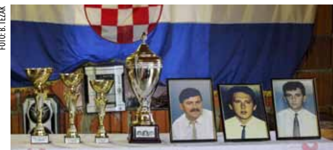
Odigravanje turnira u čast poginulih podudarilo se s obilježavanjem Dana vukovarskih branitelja