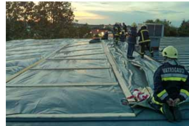
Vatrogasci su brzo intervenirali i spasili ostatak krova

Veća šteta zabilježena je i u parku nadomak Doma zdravlja Ivanec, gdje se stablo kestena srušilo na parkirani automobil. Vihor je polomio i granje u drvodredima te u parku koje je padalo na ceste i pločnike, pa je velika sreća što ozlijeđenih nije bilo. (zs,ljr)