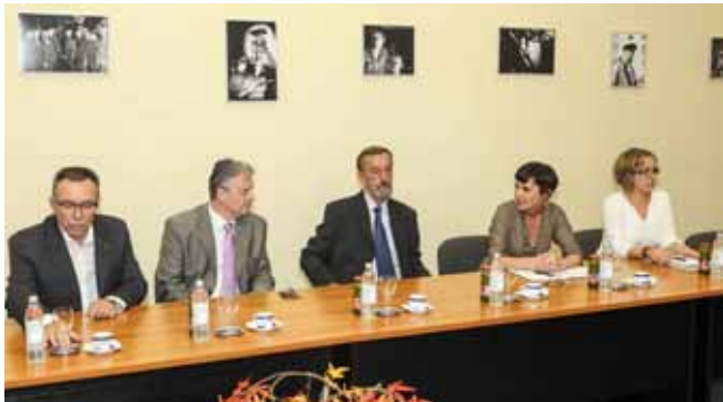
Na sastanku u Gradskoj vijećnici razgovaralo se o tome kako pomoći ivanečkim kulturnim projektima

U tom kontekstu najavio je potporu ministarstva uređenju arheološkog parka na lokalitetu