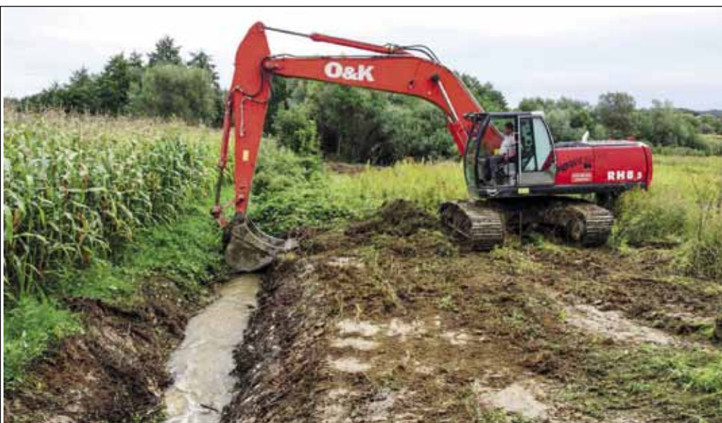
Potok će biti uređen do mosta Lančić - Vuglovec

Još u travnju ove godine je i gradski pročelnik za urbanizam, komunalne poslove i zaštitu okoliša Stan-