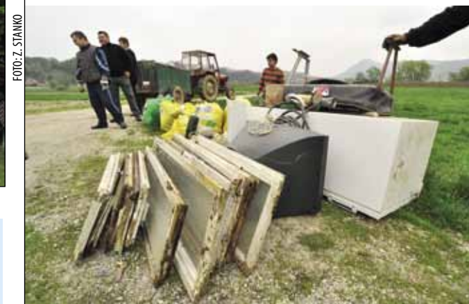
Iz Ivkoma poručuju da će s odvozom krupnog otpada u Ivcu završiti prije Svih svetih

postu u odnosu na godišnji plan. Ukupni rashodi i izdaci iznose 11,71 milijun kuna, ili 40 posto u odnosu na godišnji plan, s time da je u rashod uračunat i manjak prihoda iz prethodne godine u iznosu nešto većem od milijun kuna. Ove je godine, u odnosu na isto razdoblje lani, vidljiv porast materijalnih rashoda na stavci usluga tekućeg i investicijskog održavanja. Glavni razlog tomu su povećani izdaci za zimsku službu, zbog iznimno duge zime i velikog snijega. Također, rast bilježe i rashodi za naknade za podmirivanje troškova stanovanja što se socijalno ugroženim građanima isplaćuju temeljem programa socijalne skrbi – obrazložila je M. Darabuš te vijećnike provela i kroz druge proračunske stavke.