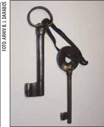
Dva stara ključa otvaraju jednu bravu iz 19. stoljeća – danas se nalazi na vratima klijeti Stjepana Jagetića Daraboša