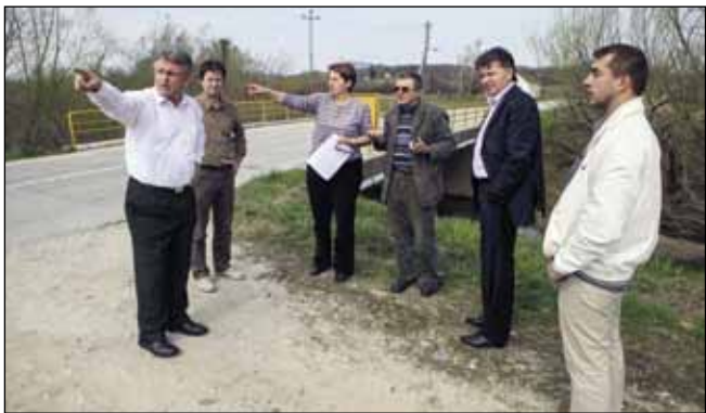
U rješavanju problema poplavlivanja uvelike su se angažirale gradske službe

♦ Radi se na pribavljanju svih potrebnih dozvola za radove, jer zbog dabrova i ekološki vrijednih močvarnih livada ovo područje pod zaštitom je Nature 2000