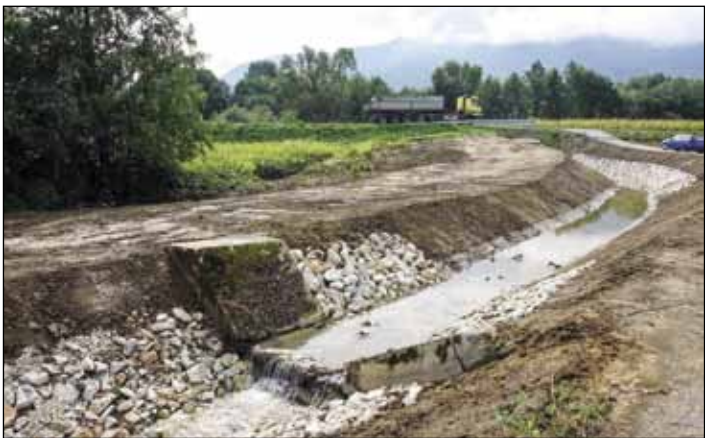
Obale Vuglovčaka mjestimično su učvršćene kamenom

Radovi se obavljaju temeljem dogovora Grada Ivanca i Hrvatskih voda – varaždinske Vodnogospodarske ispostave za mali sliv Plitvica – Bednja, pri čemu su gradske službe od vlasnika zemljišta prikupile suglasnosti da se s njihovih nekretnina strojevima mogu