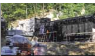
o tijeku radova Ranko Zbodulja, tehnički direktor Ivkoma.

- U drugoj fazi predstoji montaža skupe strojarne opreme, ventila, zatvaračnice i druge opreme po specifikaciji iz troškovenika, kao i izvođenje elektroinstalaterskih radova. Također, potrebno je urediti i prilazni put, sagraditi potporni zid i podići ogradu oko objekta – izvijestio je