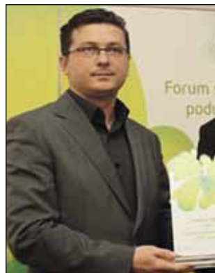
Poljoprivredni stručnjaci uvjereni su da bi otvaranje minimljekare pridonijelo obnavljanju stočnog fonda i proizvodnje mlijeka

Mirko Zimbek (HSS) kazao je da vjeruje da je osnivanje tvrtke Domaće mlijeko d.o.o. bilo u dobroj vjeri, međutim, da se već tada vidjelo da se zbog izrazito lošeg stanja stočnog fonda neće moći osigurati dovoljne količine mlijeka. Razlog