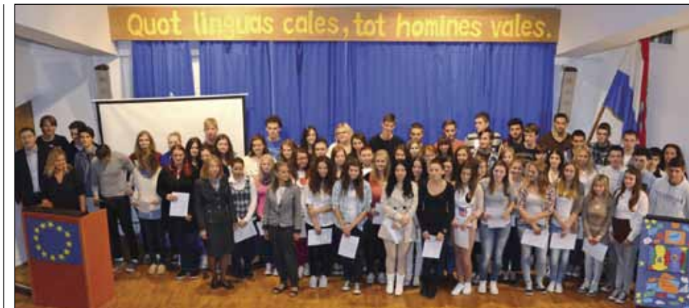
DAN EUROPSKIH JEZIKA Gimnazijalcima njemačke jezične diplome

Pripadnici specijalnih postrojbi općine Ivanec te redarstvenici Policijske postaje Ivanec sa svojim su zapovjednicima časno i odvažno odradili svoju zadaću, a sve to uz neposrednu koordinaciju Kriznog stožera općine Ivanec.