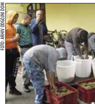
Štićenici su groždem razveselili nezbrinutu djecu, nemoćne starce, siromašne koji se hrane u pučkoj kuhinji...

Stotinjak kilograma grožđa oni su potom donirali i Pučkoj kuhinji u Varaždinu. U znak zahvalnosti, kancelar Varaždinske biskupije msgr. Antun Perčić uručio im je prigodne