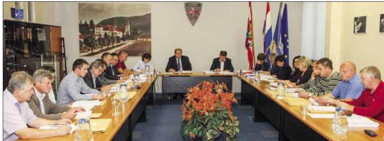
Gradskim vijećnicima na pitanja su odgovarali članovi izvršne vlasti i pročelnici