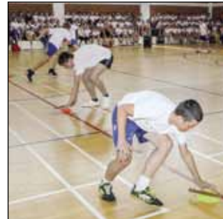
Dječaci u vježbama brzine i spretnosti

je prigodni plakat o Hrvatskom olimpijskom danu.