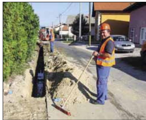
Prije radova na kolniku Ivkom je položio novi vodovod, a prethodno je rekonstruirana i niskonaponska mreža

- Predviđena je zamjena dotrajale kolničke konstrukcije, kopat će se sav stari dotrajali asfalt i slijunak te izgraditi nova prometnica širine 5,5 metara s pješačkom stazom širine 1,20 metara. Usto, obnovit će se oborinska odvodnja i urediti kolni prilazi – izvijestili su iz gradskog Upravnog