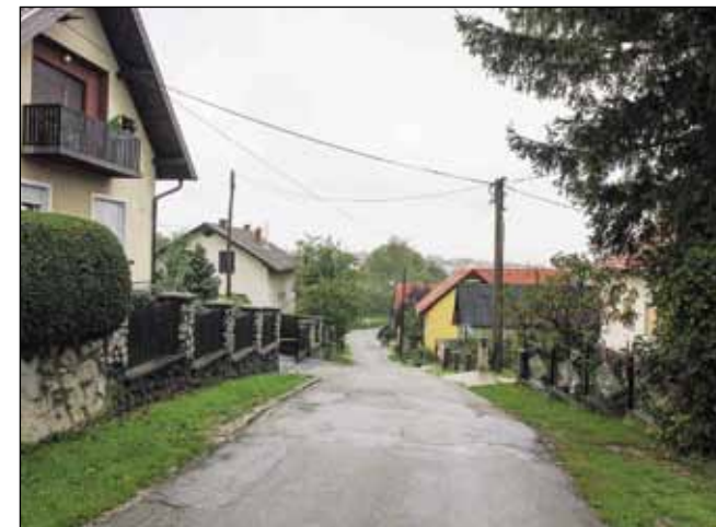
Stanari Vinogradske ulice muku muče s lošom strujom

je fazi projekt gradnje Centra za kulturu?