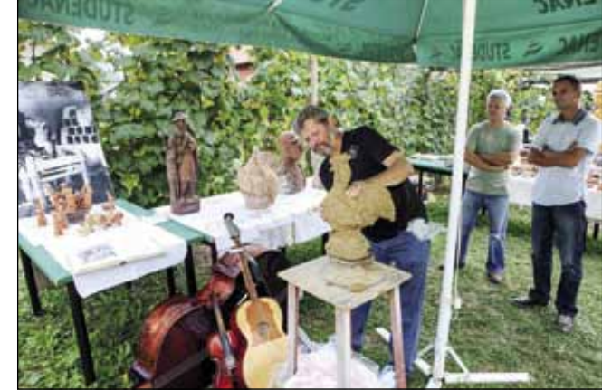
Obitelj Belac iznjedrila je mnoge umjetnike

je velikog truda i rada članova udruge i mjesnog odbora. Potporu Grada očekujemo i dalje – istaknuo je predsjednik Udruge za kulturu i sport Stjepan Petak.