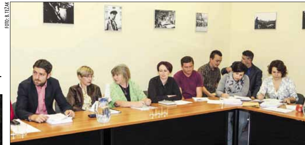
Sjednici su nazočili i ravnatelji gradskih ustanova i tvrtki

M. Batinić: Grad Ivanec zasad se u taj projekt nije uključio jer trenutačno u proračunu ne može osigurati sredstva za sufinanciranje.