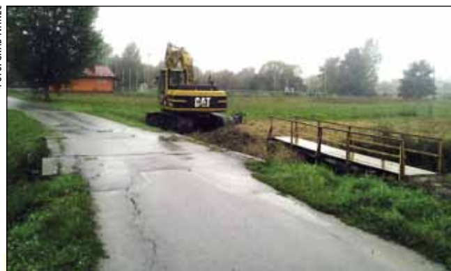
Gradnja mosta trebala bi završiti do kraja listopada

Time se vrijednost vodnogospodarskih radova što se ove godine izvode na području grada Ivanca popela prilično iznad 3 milijuna kuna. (ljr)