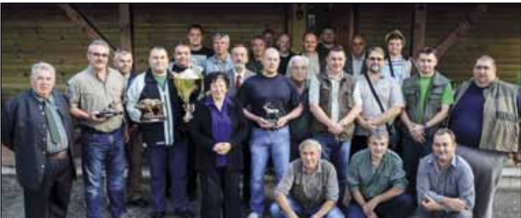
Lovci LD-a Jelen sedmi put održali Memorijalni turnir Ivan Sever

U manifestaciju su se uključili i domaći umjetnici. Ivan Belac izložio je skulpture različitih motiva, dok je njegov imenjak i prezimenjak, vlasnik Ateliera Belac, izložio razne lončarske suvenire i predmete uporabe