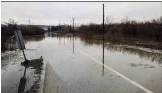
Uređenjem Bednje želi se spriječiti njeno razlijevanje i poplavlivanje kuća i ceste

U Vodnogospodarskoj ispostavi Plitvica – Bednja potvrđeno nam je da sljedeće godine napokon kreću radovi na tehničkom uređenju rijeke Bednje kod Kuljevice. Kao što je poznato, Bednja se na tom području svake godine prilikom obilnijih kiša i topljenja snijega redovito razlijeva te poplavljuje privatne kuće i županijsku cestu Kaniža – Jerovec.