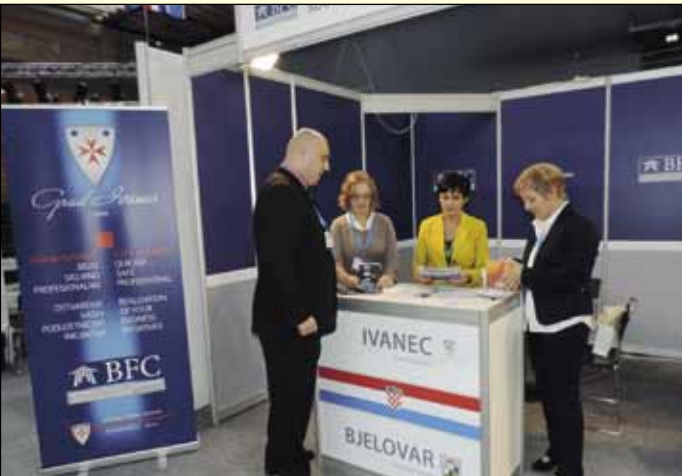
Poslovni štand Grada Ivanca u sklopu prvih „business friendly“ sredina Jugoistočne Europe koje nose BFC SEE pečat kvalitete

nama i gradovima jugoistočne Europe te naglasili važnost koji program certificiranja ima za