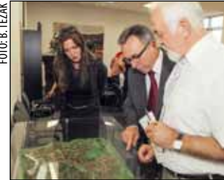
Guesti iz Zlatara sa zanimanjem su razgledali maketu s prikazom potencijalnih turističkih kapaciteta na Ivančici

Batinić se pobliže osvrnuo na pokušaje i napore Ivanca proteklih godina da sa Zlatarom uspostavi suradnju po pitanju donošenja zajedničke strategije razvitka planinskog