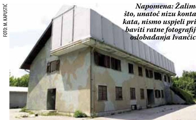
Objekt na Ivančici je, kao sofisticiran radio-relejni centar, bio vrlo važan strateški objekt za bivšu JNA

Napomena: Žalimo što, unatoč nizu kontakata, nismo uspjeli pribaviti ratne fotografije oslobođanja Ivančice