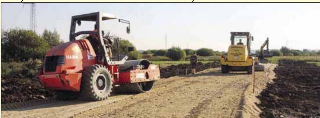
Gradi se dio prometnice u Industrijskoj zoni, kod tvrtke Wenker - Križanec

Sajam je završen uručivanjem kristalnog znaka NEXPO-a gradonačelniku bugarskog grada Plovdiva, koji će za dvije godine biti domaćin sljedećeg međunarodnog sajma lokalnih samouprava. (ljr)