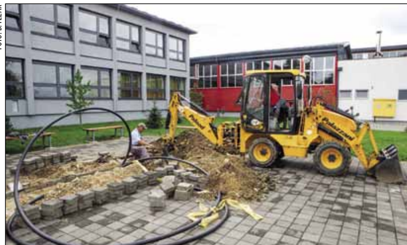
Postavljanjem svjetlovodnog kabela omogućeno je uvođenje e-dnevnika u ivanečku školu

Budući da je zbog postavljanja kabela trebalo prekopati javne površine, dozvole za izvođenje radova izdale su gradske službe, a izvođač je posebne uvjete trebao ishoditi i od Ivkoma i Elektro. (Ijr)