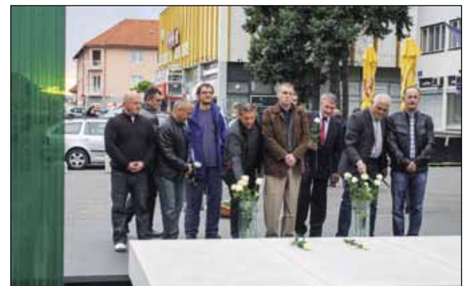
Evocirana su sjećanja na dane blokade i predaje objekta na Ivančici

Polaganjem cvijeća na središnje spomen – obilježje poginulim braniteljima na Trgu hrvatskih ivanovaca, evocirali su uspomene na dane kada su Ivančani uzeli oružje u ruke i pošli braniti Ivančicu i Ivanec od neposredne ratne ugroze. (Ijr)