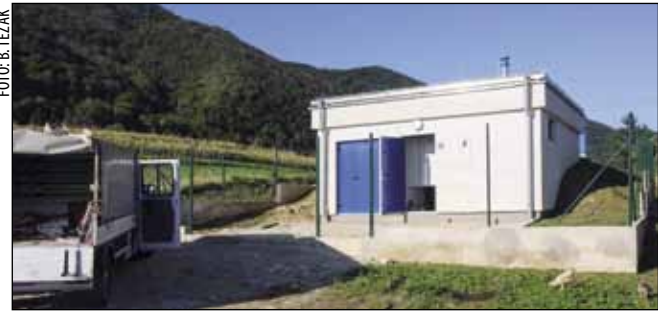
Prigorec će se od ove godine vodom snabdijevati iz novog vodospremnika kapaciteta 100.000 litara

VODNE GRAĐEVINE Grad Ivanec preuzeo vodovod u Prigorcu i prenio ga Ivkomu