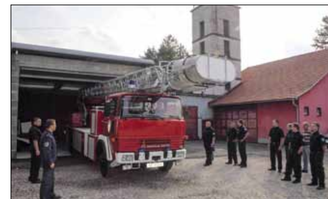
DVD Ivanec je osigurao kvalitetan smještaj za vozilo

Vatrogasci su zadovoljni obavljenim poslom, to više što je poznato da su se autoljestve (koje je DVD nabavio u Njemačkoj za 10.000 eura), u vrlo kratko vrijeme isplatile, jer ih DVD često koristi za hitne i uslužne intervencije ne samo na području grada Ivanca, već i u široj okolici. (Ijr)