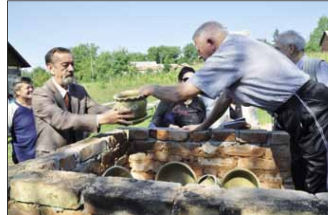
Tijeglini, zdele i zdelice – sve to ide na pečenje u pečnicu D. Stanić

Cijela priča oko Etnokuće počela je prije četiri godine. Ovo što danas vidite rezultat