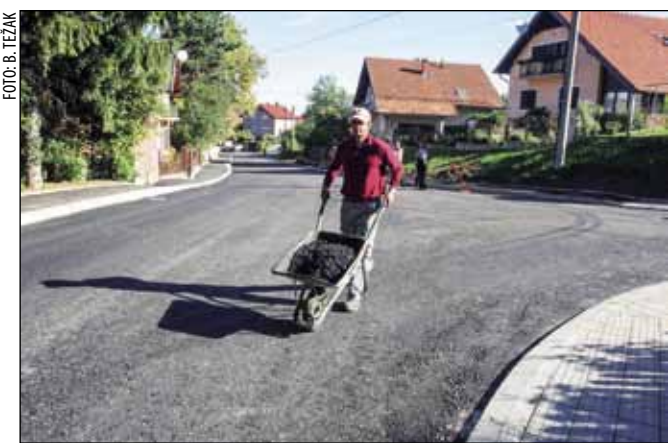
Finim asfaltnim slojem Kukuljevićeva će biti presvučen iduće godine, nakon dovršetka svih predviđenih radova

Inače, pripreme za modernizaciju te ulice počele su još 2010., kada je Ivkom krenuo s rekonstrukcijom vodovodne i plinske mreže. Važno je znati da je Kukuljevićeva tek jedna u nizu ulica čije je osuvremenjivanje planirano kapitalnim gradskim projektom uređenja