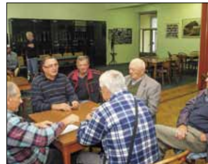
Od 1. listopada Udruga umirovljenika dijeli prostor s Udrugom ILO

su često surađivali, očekuje se da će s boravkom u istim prostorima (obje udruge usto su se sporazumjele da će im i uređovni dani za rad sa svojim članovima biti u istim terminima) ta suradnja ubuduće i pojačati. (Ijr)