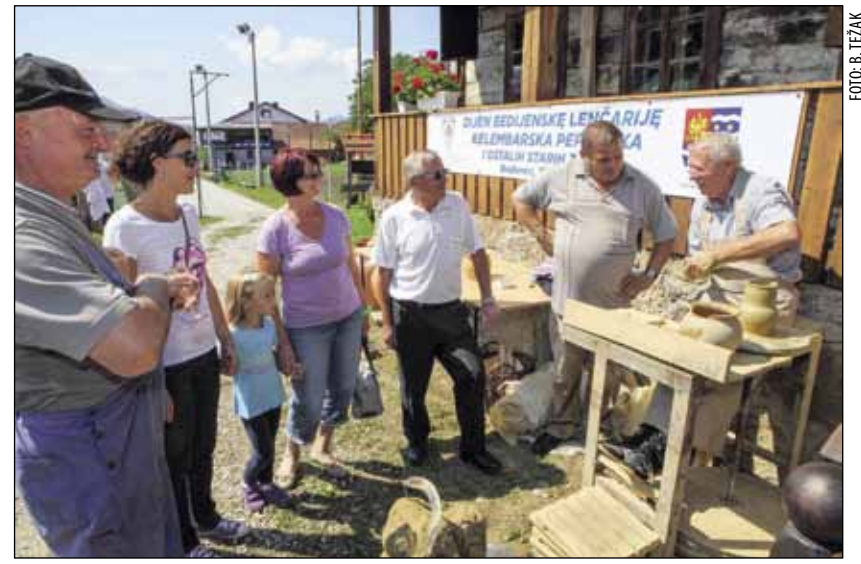
Nekad je većina mještana za život zarađivala s nogom na kelembaru