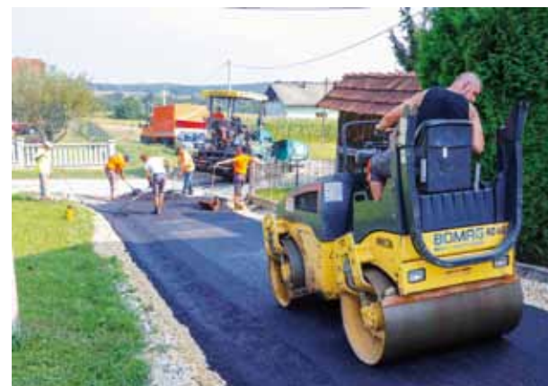
Asfaltiranje nerazvrstanih cesta