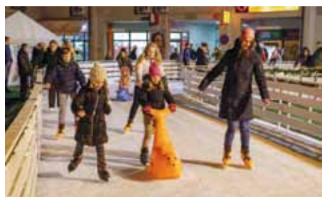
Klizalište u Ivancu