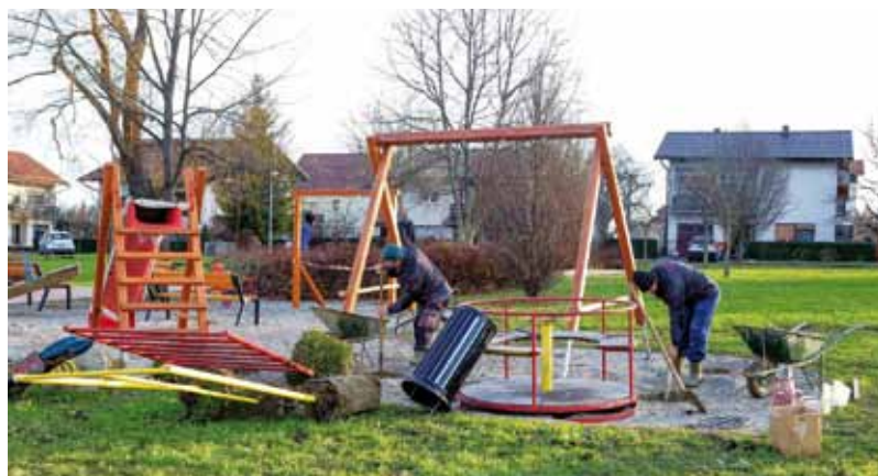
Dječje igralište u Kumičićevoj