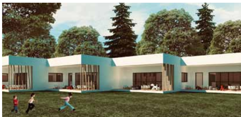
Dogradnja dječjeg vrtića Ivančice