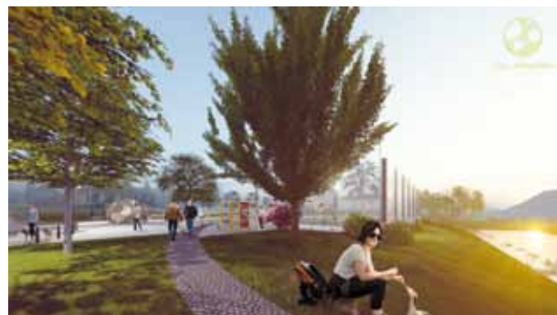
Trg i dječje igralište u Margečanu