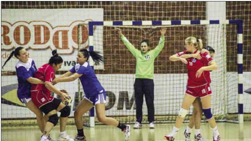
Prvi susret s Dardom Ivančanke su izgubile

♦ U Ivancu je s 28:25 poražena ekipa Broda Gymnasium