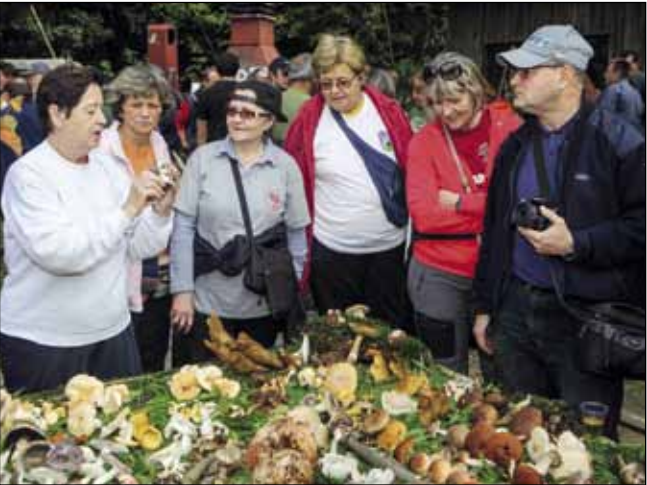
U cilju edukacije građana izložene su razne vrste jesti- vih, nejestivih i otrovnih gljiva