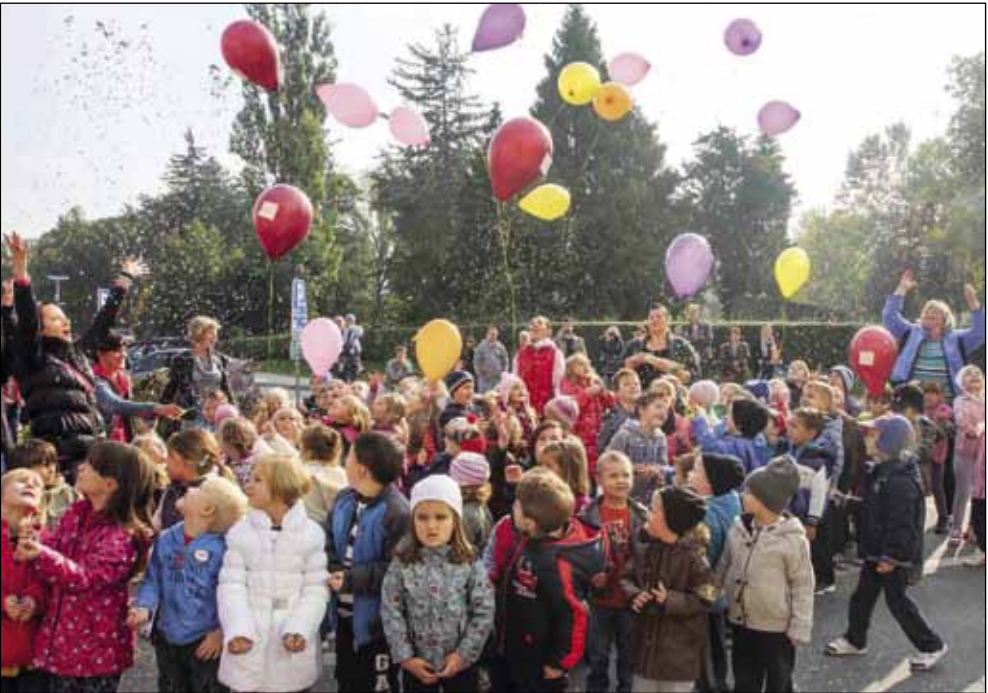
Lete, lete šarene konfete: Dječji tjedan je otvoren!