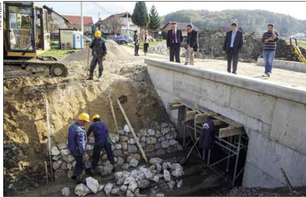
Novi most stabilna je i sigurna konstrukcija, a financiraju ga ministarstvo i Grad Ivanec