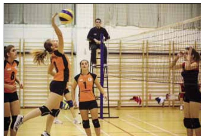
Ivančanke su porazile KOP iz Čakovca s uvjerljivih 3:0 u setovima

Utakmica MNK Drvodjelac – Bedenec: 3:2. Vodstvo Drvodjelcu donio je Kljunić, na 1:1 je izjednačio Cikać, a Bunić zabio za vodstvo Bedenca od 2:1. Uslijedio je pogodak Gotala za izjednačenje na 2:2 Pobje-