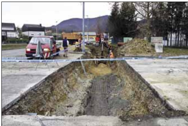
Troškovi gradnje kolektora na ivanečkom području procjenjuju se na 18,7 milijuna eura (ilustracija)

Njihova je zadaća da u roku 21 mjesec izrade kompletne projekte za poboljšanje sustava vodoopskrbe i integriranog sustava upravljanja otpadnim vodama na području buduće aglomeracije. Oni će biti podloga za prijavu Aglomeracije za sufinanciranje sredstava strukturalnih fondova EU, a sve u cilju konačnog rješavanja problema otpadnih voda koje sada onečišćuju Bednju i ostale vodotoke.