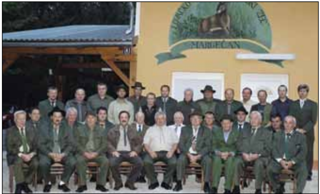
Velikim trudom i angažmanom lovci su uzorno uredili dom

Uz fizičke radove na ure- đenju doma i okolnih objek- ta, lovci su stigli zasijati i dva hektara kukuruza za prihranu visoke divljaci, a održavaju i 15 visokih čeka, po 20 hranilišta za visoku i nisku divljač, 20 šolišta te sedam izvora prirodne vode. U zakupu imaju 3.700 ha lovi- šta, od čega oko 70 posto čine lovno-produktivne površine na kojima najviše obitavaju div- lje svinje, srne, fazani, zečevi, patke...Na području uz rijeku Bednju ima i vidre te dosta da- brova. (ljr)