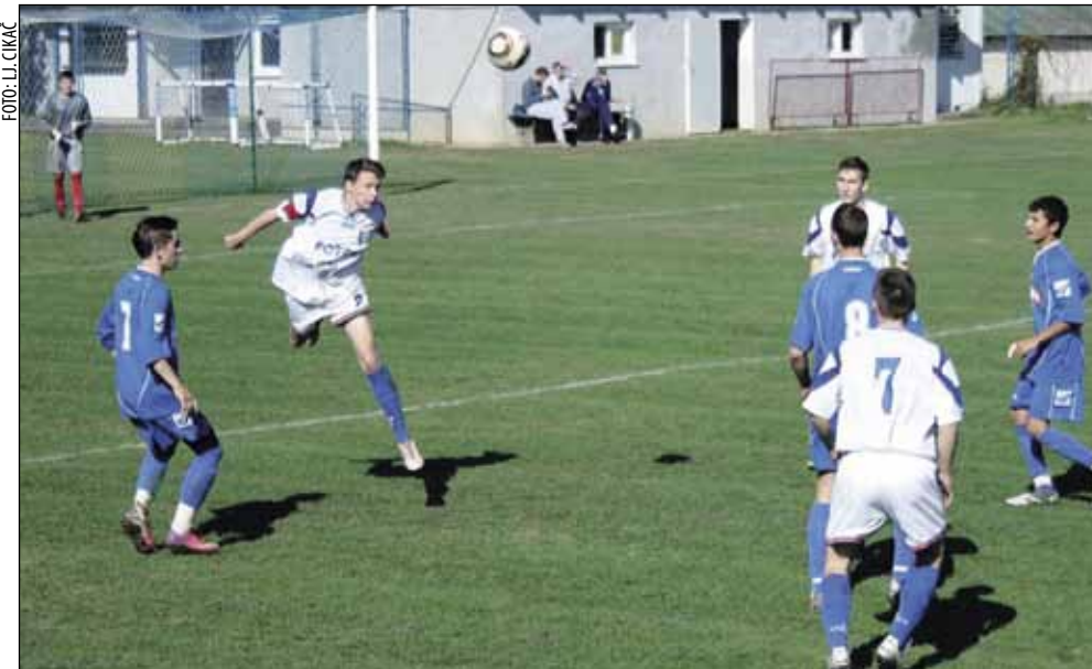
Sva energija usmjerena je na rad s mlađim klupskim uzrastima Ivančice