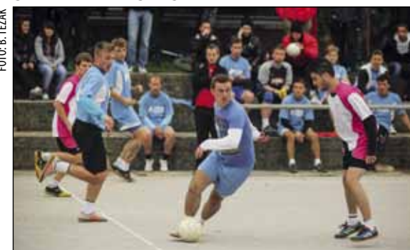
Malonogometne utakmice u prosjeku prati stotinjak gledatelja

♦ Itas i Prigorec čvrsto na vrhu tablice