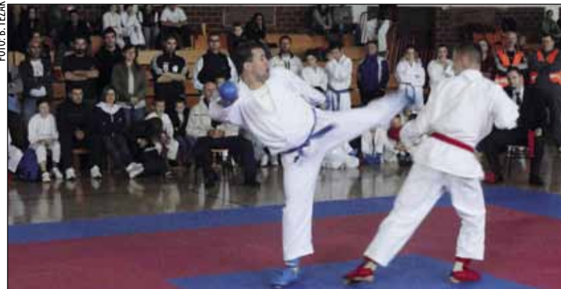
Ivanečki karataši u pojedinačnoj su i ekipnoj konkurenciji osvojili 20 medalja

Pješački pohod uz Svjetski dan pješčenja