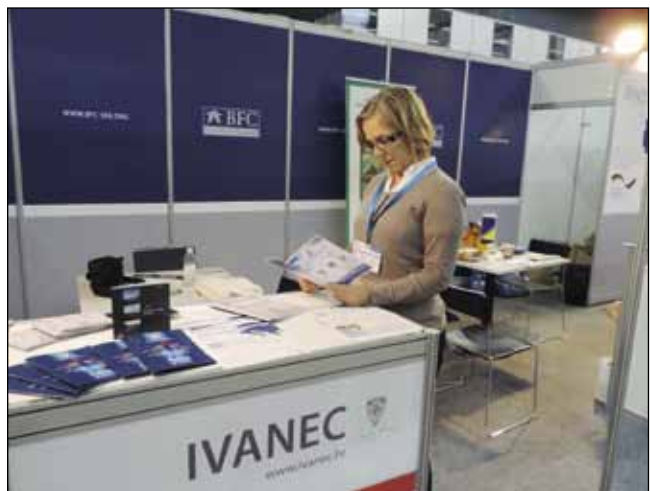
Na sajamskim manifestacijama se putem brošura i direktnog kontakta promiču mogućnosti ulaganja u Ivancu

Naš Grad je na EXPO-u sudjelovao sa skupinom gradova iz naše županije kojima je predstavljanje na najvećem europskom sajmu za komercijalne nekretnosti omogućeno u suradnji s Poslovnim zonama Varaždin, Ministarstvom gospodarstva, Agencijom za investicije i konkurentnost te s Varaždinskom, Krapinskom i Bjelovarskom županijom.