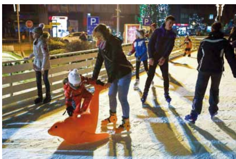
Da se pitalo djecu i roditelje, klizalište je na špiči moglo ostati do – proljeća

UZ POMOĆ PROJEKTOG UREDA ZA EU FONDVE Udruzi Nada odobren projekt vrijedan 203.825 kuna