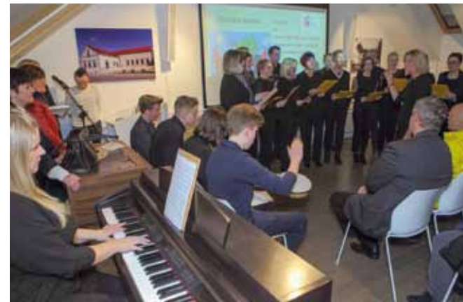
Školsku himnu otpjevao je Zbor djelatnika Osnovne škole Ivanec

skom zgradom. Izložbu prate 84 eksponata koji su za ovu priliku posuđeni iz zbirke desetak škola, udru-