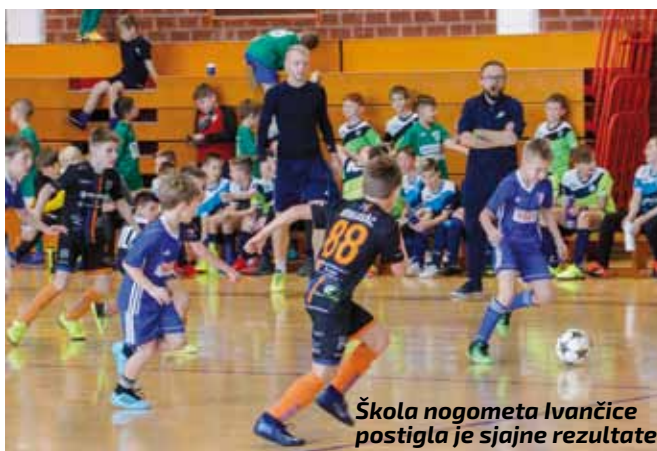
Škola nogometa Ivančice postigla je sjajne rezultate

s 1:2, a u utakmici za 3. mjesto je svladala NK Varteks s 2:1. Najbolji strijelac bio je Noa Kučej, NK Ivančica.