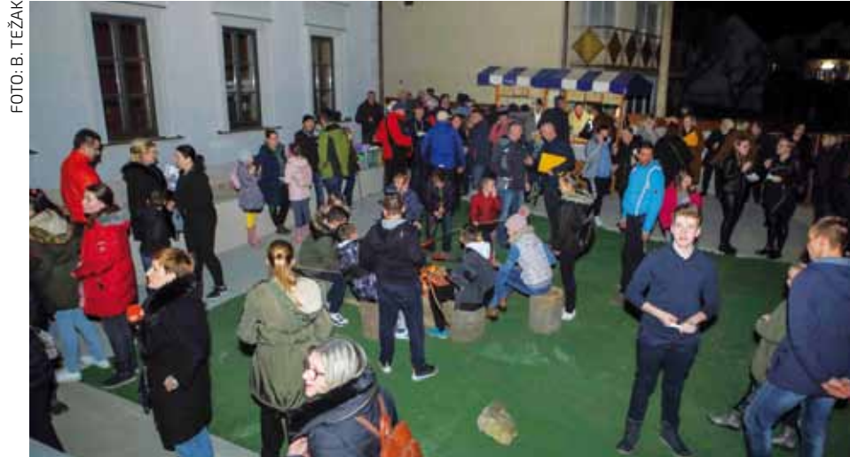
Planinarska atmosfera u dvorištu muzejske zgrade

Službeni program Noći muzeja počeo je izložbom Od stare škole do suvremenog muzeja, koju je