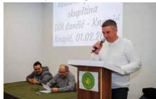
Prvi put u energetske obnovljenom društvenom domu – Godišnja skupština DŠR-a Lančić-Knapić

Odgovarajući na pitanja o SRC-u Lančić, poručio je da se ove godine nastavljaju radovi koji su lani počeli dosta kasno (zbog