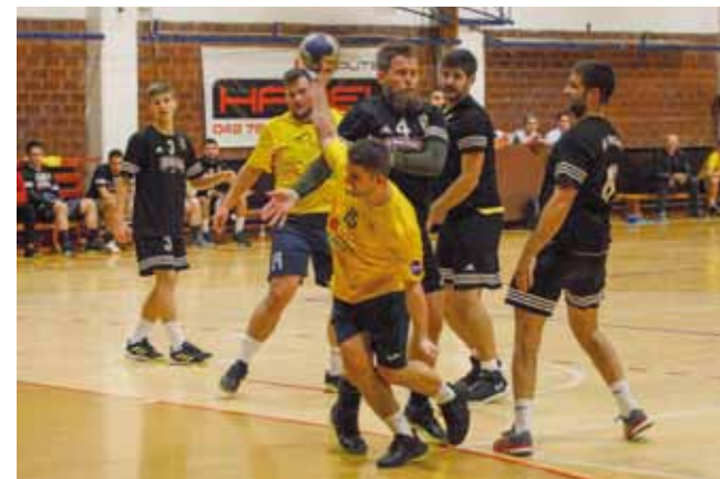
Temeljem nove kategorizacije sportova, najviše javnog novca namijenjeno je sportovima u prvoj natjecateljskoj skupini

Mladost u proljetnom dijelu prvenstva ima jedinstven cilj igrača i Uprave kluba - izboriti prvo mjesto i plasman u viši rang natjecanja.(nn)