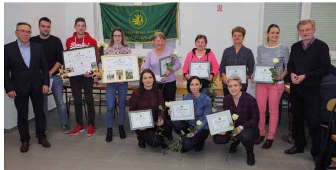
Najbolji rekreativci i ekipe Lančić-Knapića u 2019. godini

Na izložbi je najljepše primjerke malih životinja pokazalo 73-oje izlagača