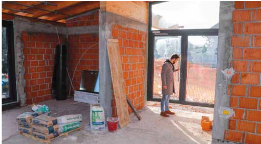
Nekadašnja terasa je zatvorena i pretvorena u prostor u kome će biti višenamjenska dvorana

da će ga obnoviti, urediti i dati na korištenje mladima i gradskim udrugama (prvenstveno Klubu mladih i KUD-u Rudolf Rajter), krajem prošle godine počelo je izvođenje radova u prvoj fazi.