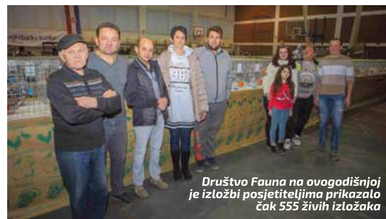
Društvo Fauna na ovogodišnjoj je izložbi posjetiteljima prikazalo čak 555 živih izložaka

A da u 2020. DŠR planira raditi još ambicioznije, potvrđuje i iznimno bogat program rada koji je iznio G. Habek. Na skupu su pri-