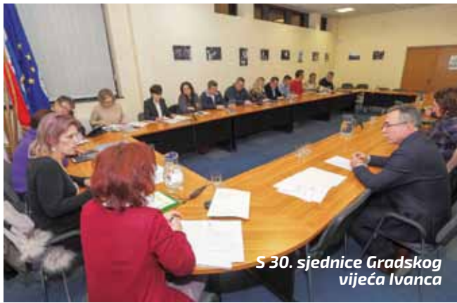
S 30. sjednice Gradskog vijeća Ivanca

– Također se očekuje da će za sve članice EU, pa tako i za Hrvatsku, biti pooštreni kriteriji dodjele sredstava. U kontekstu informacija da će top teme biti vezane uz klimatske promjene, a vezano uz činjenicu da je u proteklom vremenu Grad Ivanec po tom pitanju već proveo neke aktivnosti, u gradskoj upravi već promišljamo pojedine specifične projekte za EU natječaje koji će se otvarati idućih godina – završio je M. Batinić. (ljr)