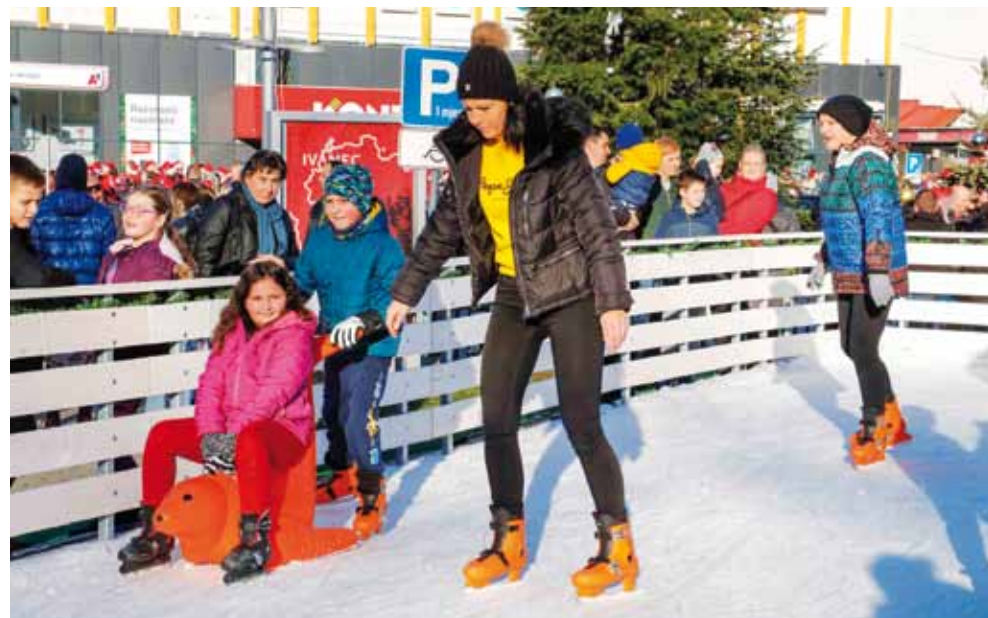
Uživanje na ledu