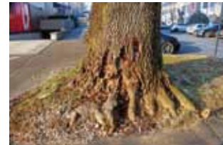
Glijive truležnice razgrađuju deblo, a stablo odumire

lako naoko velik i zdrav, hrast je bolestan i zbog mogućnosti loma predstavlja opasnost za građane i njihovu imovinu