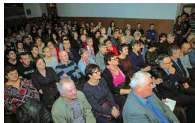
Dani glume u Stažnjevcu – u dvorani se traži mjesto više

Domaćinima je na jubileju čestitao gradonačelnik Milorad Batinčić.