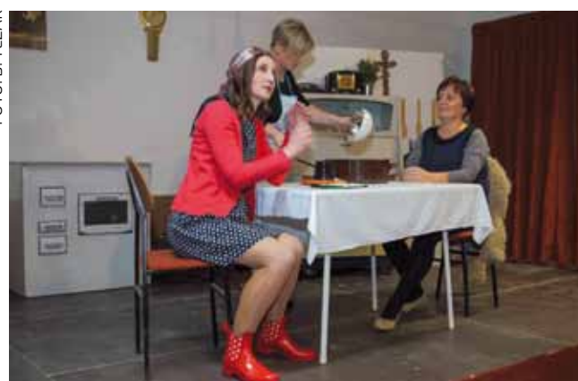
Uz čašicu rakije...