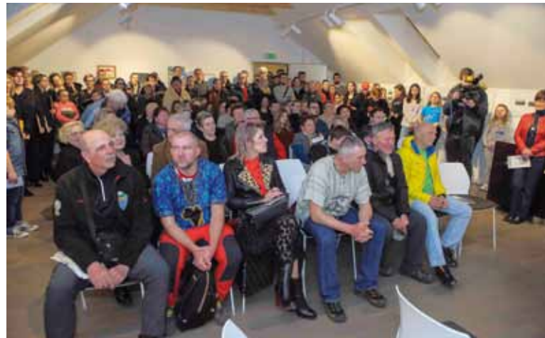
Burnim aplauzom Ivanec je na službenom dočeku u Muzeju planinarstva pozdravio osvajače Kilimandžara (u prvom redu)

–Kilimandžaro je najviši vulkan i najviša samostojna planina na svijetu, a obiluje kontrastima koje teško možete zamisliti. Ovaj pothvat velik je iskorak i uspjeh koji afirmira Ivanec kao Planinarski grad u pravom smislu te riječi i on treba biti podstrek djeci koja se još danas igraju kod Žganog vina da već sutra budu spremni za nove izazove i da im oni budu vodilja koja će ih maknuti od mobitela i kompijutora. Nakon svega što smo vidjeli i doživjeli