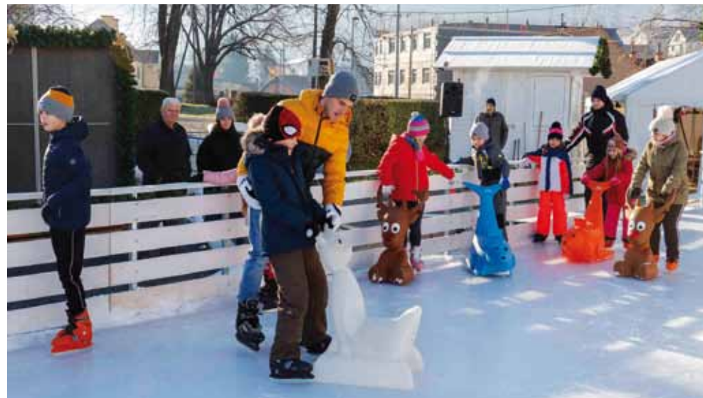
Prva Škola klizanja u Ivancu