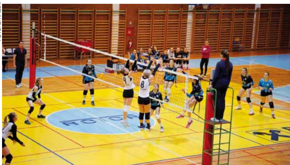
Seniorke ŽOK-a Ivanec pobijedile su Bjelovar s 3:1 u setovima