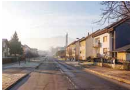
Jedan od najvrjednijih projekata bit će rekonstrukcija Ulice Eugena Kumičića

Slijedom toga, Hrvatske vode u svoj su program rada za 2020. uvrstile desetak vodotoka i to onih za koje je tijekom zajedničkog obilaska terena i uvidom u probleme koje izazivaju utvrđeno da ih je potrebno uvrstiti na listu prioriteta. Tako će se ove godine raditi na nastavku čišćenja i tehničkog uređenja potoka Bistrice u Prigorcu te potoka Željeznice u I. Željeznici, kao i potoka Brežnjak u Margečanu, uključujući i kanal kod igrališta. Nadalje, radit će se i na uređenju kanala Salinovac (oko 300 metara), zatim korita i obala potoka Vukovec (uzvodno od državne ceste) te Vinskog potoka u Stažnjevcu.