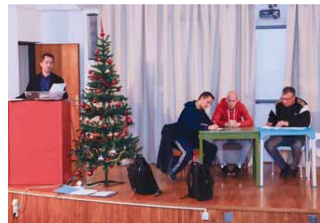
Skupština je prihvatila izvješća za 2019. godinu te donijela program rada i financijski plan za 2020.

Prioritet kluba je razvoj Škole nogometa za djecu i stvaranje boljih infrastrukturnih uvjeta, što je projekt koji NK provodi u suradnji s Gradom Ivancem. Škola nogometa je po rezultatima i kvaliteti druga na području Varaždinske županije jer djeca se natječu u 1. NL, odnosno u najvišem državnom rangu natjecanja.