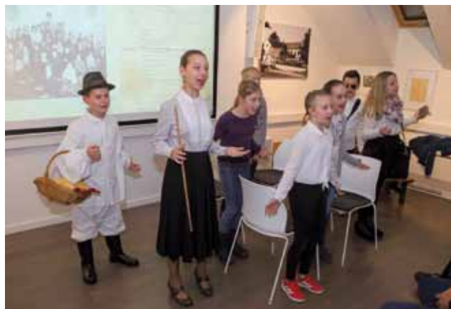
Dramska grupa OŠ Ivanec