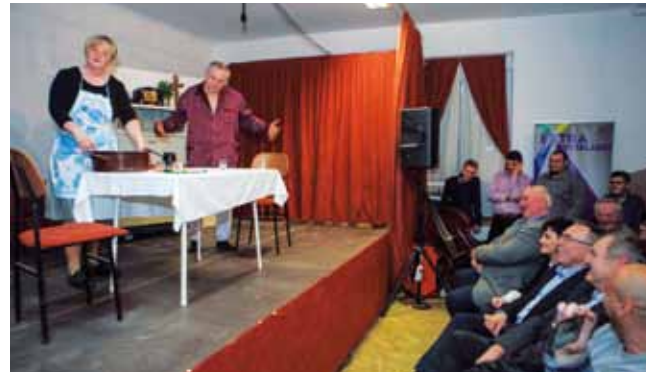
Komedijaši u novoj urnebesnoj komediji Sretna vijest

-Grad je preuredio staru školu upravo zato kako bi se u njoj mogle održavati mani-festacije poput ovih. Dodatna sredstva izdvojili smo i lani, u cilju uređenja prostorija i grija-nja za prijam gostiju, a nasta-vak radova na uređenju podova kreće ove godine. Pozivam vas da vašu novu predstavu održite u Kinu Ivanec te da njome na-smijete i Ivačane – pozvao je gradonačelnik.