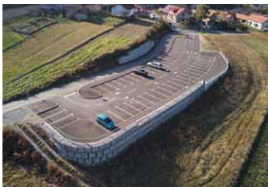
Sastavni dio projekta brendiranja Ivanca gradnja je i turističke infrastrukture - novo parkiralište iznad Prigorca izgrađeno EU sredstvima

–Od navedenih 11 milijuna kuna 8 milijuna namijenjeno je predškolskom odgoju. Uz rad vrtića, svim roditeljima sufinanciramo smještaj mališana u vrtićima, bez ob-