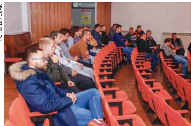
Sa godišnje skupštine NK Ivančice

finale Županijskog nogometnog kupa, gdje Ivančica u polufinalu igra dvije utakmice s Oračem iz Petrijanca, a oba finalista imaju pravo nastupa u pretkolu Hrvatskog nogometnog kupa (gdje Ivančica nije nastupila već zadnjih nekoliko sezona). Također, nastojat će izboriti naslov prvaka u 4. NL Čakovec – Varaždin i tako se plasirati u viši rang natjecanja.