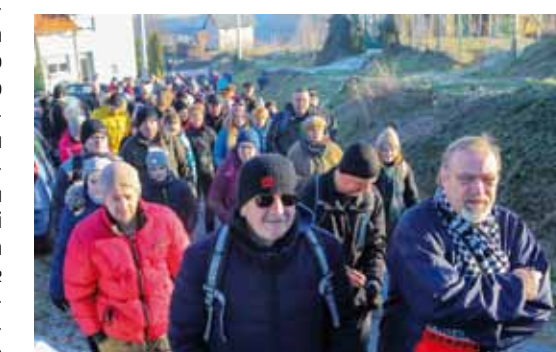
Početak pohoda na stazi dugoj 9 kilometara

Izletu su se odazvali rekreativci iz doslovce, cijele Varaždinske županije. DŠR bio im je i ove godine