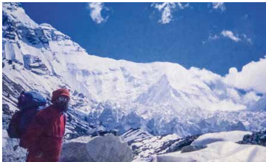
Dosad neobjavljena fotografija sa Zagrebačke ekspedicije na Everest, prve autonomne hrvatske ekspedicije na M. Everest, u sjevernoj stijeni s tibetske strane (rujan-studen 1989.)

Među zanimljivijim izlošcima bit će: šatori s