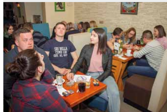
Popularni pub quizovi i dalje ostaju u fokusu rada Kluba mladih

Ovaj kviz imao je humanitarnu notu jer sve uplaćene kotizacije mladi su poklonili obiteljima koje žive u teškom imovinskom i socijalnom stanju.