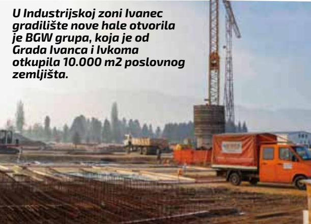
U Industrijskoj zoni Ivanec gradilište nove hale otvorila je BGV grupa, koja je od Grada Ivanca i Ivkoma otkupila 10.000 m2 poslovnog zemljišta.

– Za novi rotor u izradi je projektna dokumentacija, a prema mojim informacijama, radovi bi trebali uslijediti ove godine. To je investicija Hrvatskih cesta, međutim, u nju će se u pripadajućem dijelu uključiti i Grad Ivanec, slično kao i kod gradnje rotora na raskrižju Preradovičeva – obilaznica (kod Ivančice d.d.)