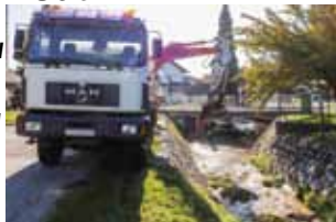
Ove godine slijedi nastavak radova na uređenju potoka Bistrice

da iako vodotoci nisu u nadležnosti Grada Ivanca, on i unatoč tome često priskače u pomoć Hrvatskim vodama na način da u partnerskoj suradnji zajedno interveniraju i uređuju najkritičnije potoke i kanale, prvenstveno one koji poplavljuju i uzrokuju štete na stambenim i gospodarskim objektima građana te na javnoj infrastrukturi. (ljr)