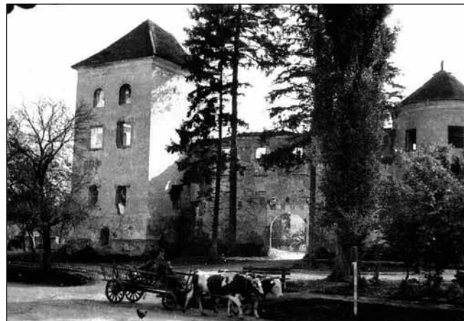
Rodni list grada Ivanca

Isprava - privilegij izdan 22. lipnja 1396. rodni je list grada Ivanca. Nije sačuvana u originalu, već je vjerodostojna kopija, odnosno prijepis ranije isprave umetnut u novu ispravu.