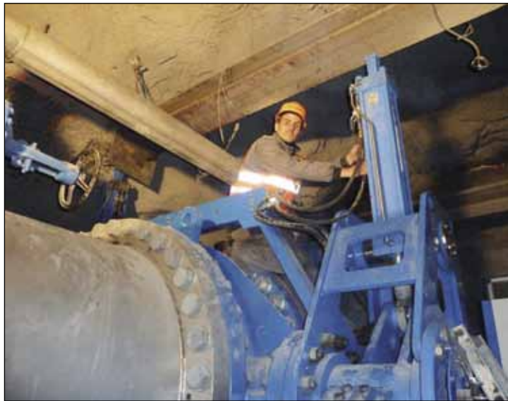
Hydromatovi monter ugrađivali su opremu za polarnu HE u Norveškoj u tunelima dugim 3 kilometra

GMBH, koji su ugrađeni u vododistributivni sustav kineskog grada Daliana (6,2 milijuna stanovnika). Sličnu smo opremu isporučili i za jednu TE u Belgiji, vrijednu 440 milijuna eura. Posebno smo ponosni što je mali Hydromat na tom projektu surađivao s velikim Siemensom – naglašava Canjuga.