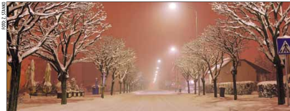
CESTE U katastru javne rasvjete je 2.300 rasvjetnih mjesta i šezdesetak trafostanica

Ako nemate Europsko izvješće, obavezno razmijenite podatke iz police osiguranja od autoodgovornosti i ne zaboravite – bez toga ne napustate mjesto nesreće. (ljr)