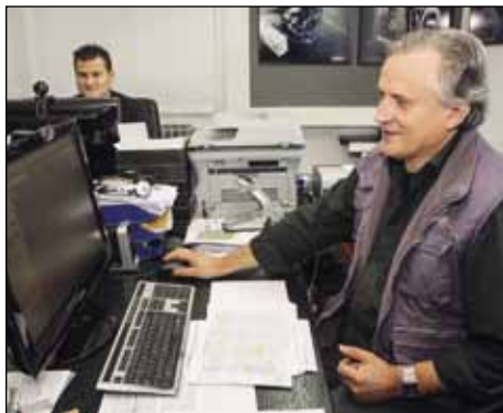
Projektni biro „mozak“ je Hydromata

-Izradili smo dva prototipa i nultu seriju za dvije veličine ventila. Prva serija je ugrađena u najveću TE u regiji (Tuzla), a naše su sustave Austrijanci instalirali i na jednoj elektrani na obali Crnog mora. Očekujemo i službenu dodjelu isprave od Europskog patentnog zavoda o priznatom patentu regulacijskog ventila, a u proceduri je i ishođenje isprave kod Američkog patentnog zavoda. Postoji veliki interes od vodećih njemačkih grupacija Talis