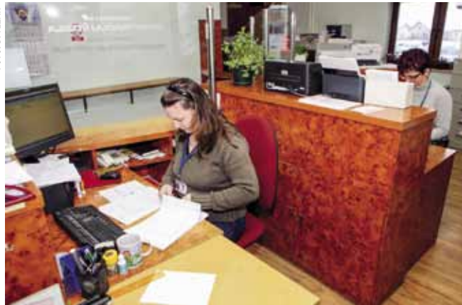
Radno vrijeme upravnih poslova ostaje kao i dosad

U raspravi o toj temi postavilo se i pitanje kako će se u novoj organizaciji obavljati privođenja. Pojašnjeno je da će se privođenja u PP Ivanec obavljati i dalje, tako dugo dok se u Va-