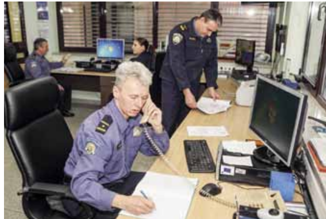
PP Ivanec od početka je veljače u novom organizacijskom pilot projektu MUP-a

–Prije svega, radnim danom poslije 15 sati, pa sve do sljedećeg dana do 7 sati, policijska postaja Ivanec zatvorena je za rad sa strankama. Isto je subotom, nedjeljom i praznikom, a to znači da je postaja zaključana i da u zgradi nema