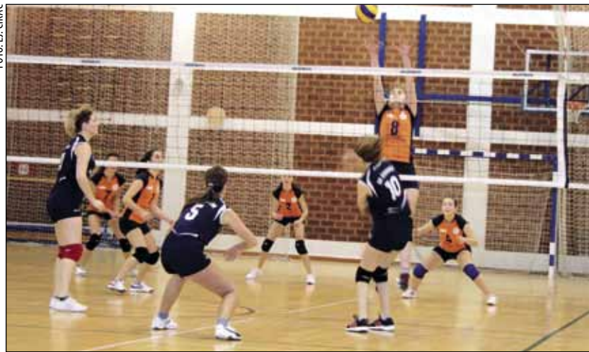
Ivančanke su tijesno poražene u derbiju sa Štrigovom