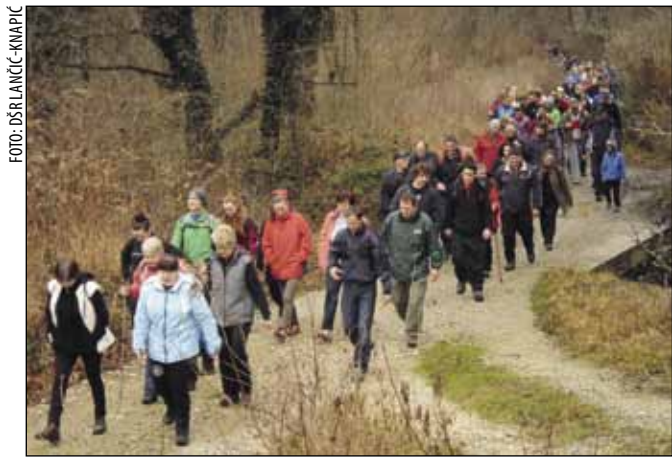
Nakon blagdansko obilja, pješačenje je dobrodošlo za ponovno vraćanje u kondiciju

DŠR LANČIĆ-KNAPIĆ 4. pješačenje na blagdan Sveta tri kralja