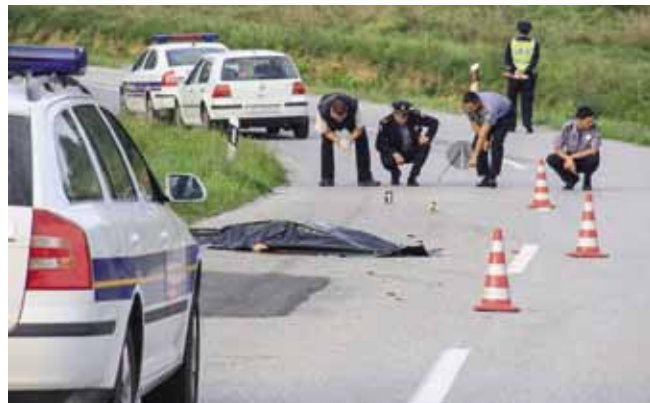
Očevide kod prometnih nesreća preuzela je prometna policija Varaždin