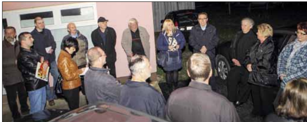
Na sastanku su građani informirani o pojedinostima vezanim uz planirano uređenje drvoreda

–Građani pritom ne bi imali nikakvih obveza. Sadnice bi se nabavile o trošku Grada, a zasadio bi ih Ivkom. Odlučite li se za, stabalca bi se zasadila s