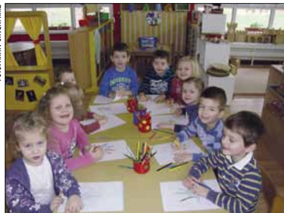
Ivanečki mališani rado se uključuju u humanitarne akcije

vati svu našu zahvalnost – istaknuo je predsjednik Josipović te u ime Republike Hrvatske zahvalio darivateljima na njihovom plemenitom činu.