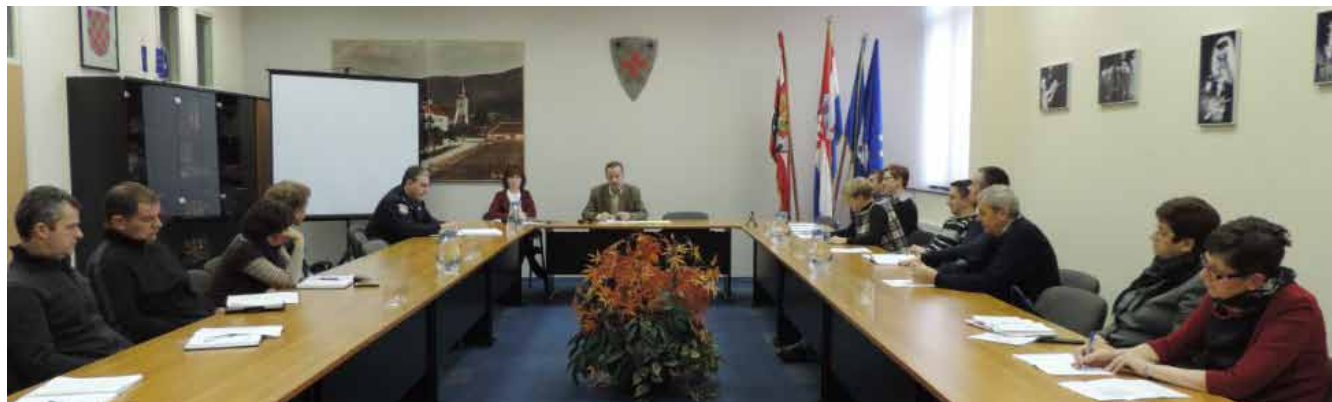
Novi ustroj rada ivanečke policije bio je glavna tema Vijeća za prevenciju Grada Ivanca

i gradskih službi, Katastar je izradila AZRA, a on je potom poslužio kao podloga za izradu Strategije modernizacije NC-a. Takav dokument je glavni vodič o tome što, kako i kada raditi i, dakako, osnova za prijavljivanje programa na fondove EU. (ljr)