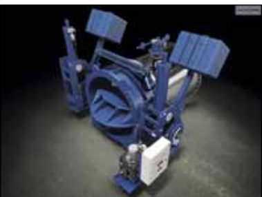
Hydromatovi hidraulični sustavi isporučuju se za TE i HE na najvećim svjetskim gradilištima

U skladu s trajnim opredjeljenjem – a to je da ne žele raditi po tuđim projektima, a niti prihvaćati lohn poslove jer, uvjereni su, takva praksa dovodi do pretvaranja tvrtki u obrtničke radionice – poslovodstvo Hydromata kontinuirano razvija vlastiti high tech i nove patente.