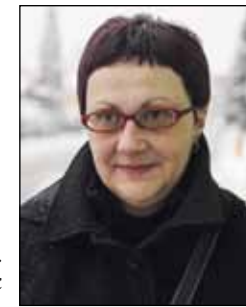
Piše: dr. sc. Suzana Jagić

Iz iste je isprave vidljivo i to da je na tome mjestu postojalo naselje koje je prije bilo razvijeno, jer se spominju sukobi s Nijemcima, vjerojatno grofovima Celjskim koji su, moguće, oteli Ivančanicima njihove starije listine s privilegijima. Pretpostavka je da su ivanovci dobili u posjed već oblikovano naselje na sjevernim obroncima Ivančice