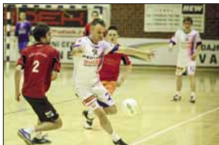
Zimski malonogometni turnir Kaj kup ivanečki je nogometni brend