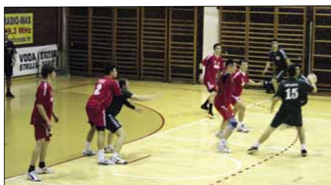
Momčad Vidovca Ivančani su porazili s 33:30

U utakmici 12. kola, Ivančica je u gostima pobijedila Novsku sa 34:27, a u sljedećem kolu i Garešnicu s 30:26. Nakon vod-