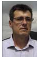
Piše: Boris Jagetić Daraboš

♦ Najatraktivnije su bile grupe mačkara mladenaca; bile su dobro organizirane, s mozikom su obilazile sela, a domaćini su im priređivali poseban doček