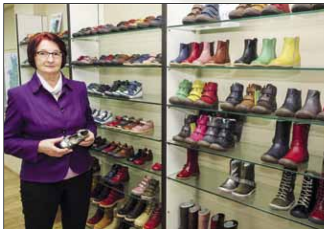
Ponos Ivančice – vlastite robne marke kao hrvatski proizvod za strana tržišta