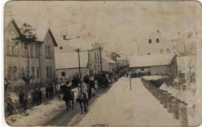
Fotografija ivanečke fašničke povorke iz 30-tih godina prošloga stoljeća

Najveću pozornost i zanimanje pobuđivali su mačkari