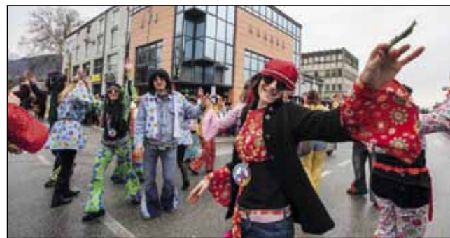
Vodite ljubav, a ne rat! – poručila je „napušena“ skupina iz Svetog Jurja na Bregu

VATROGASTVO Članovi DVD-a Salinovec i gosti na godišnjoj izvještajnoj skupštini