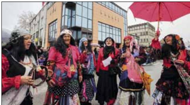
Otkučeno, šareno, zabavno...

pokrovitelj Fašinka u Ivancu i ove je godine bio Grad Ivanec, koji je pokrio troškove njegove organizacije i prihvata gostiju, a pridružila se i gradska Turistička zajednica. (ljr)