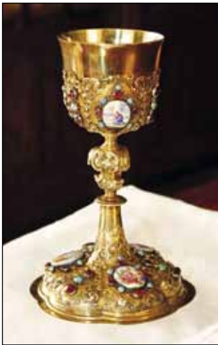
Vrijedno blago ivanečke crkve – kalež iz 1721. godine, ukrašen biljnim ornamentima, poludragim kamenjem i medaljonima

Kapela je imala veoma vrijedno crkveno posuđe od kojeg su pojedini primjerci sačuvani i danas. Vrijedni su srebrni i pozlaćeni kaleži od kojih se ljepotom ističe kalež od pozlaćenog srebra nastao 1721. godine u Beču, ukrašen biljnim ornamentima, poludragim kamenjem i emajliranim medaljonima s biblijskim prizorima. Još je stariji srebrni i pozlaćeni kalež s natpisom iz 1687. godine. Iz XVII. je stoljeća do danas sačuvan i nadgrobni spomenik Ivana Petheöa koji je prikazan u vojničkom odijelu, s oklopom, buzdovanom, sabljom i kacicom. Kod glave nalazi mu se grb u obliku patke između dva rogova na vodi. Natpis pod andeoskom glavicom navodi 1616. kao godinu njegove smrti.