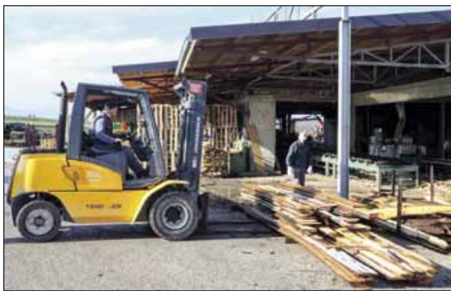
Pilana je obiteljski obrt s 50 godina dugom tradicijom (sin Stjepan radi na viličaru)

nost piljenje trupaca, proizvodnja piljene građe, zidnih obloga (brodskog poda i lamperije) i razne drvene ambalaže te nježno termičko tretiranje, za što posjedujemo certifikat. Na go-