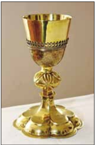
Stari srebrni i pozlaćen kalež s natpisom iz 1687. godine

Kapela Svetog Ivana Krstitelja prvi se put navodi u kanonskim vizitacijama 1649.