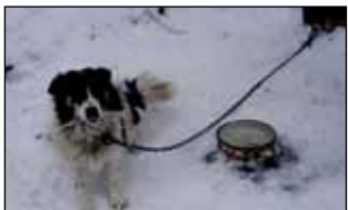
Neki se ne libe psa vezati na lanac od tek pola metra

Prema Zakonu o zaštiti životinja (koji je usklađen s normama EU), vlasnik koji ubije