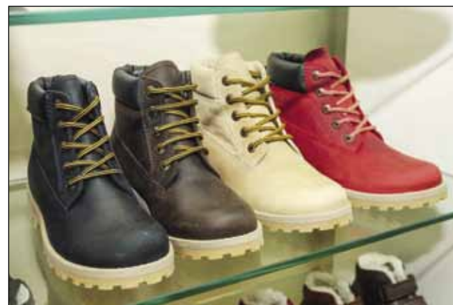
U dizajnu obuće koriste se usluge inozemnih modnih dizajnera