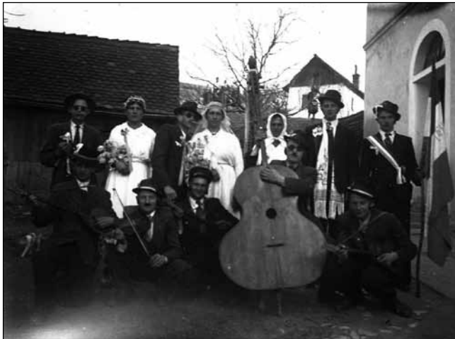
Mačkari mladenci u ivanečka su kućanstva bili dobrodošli