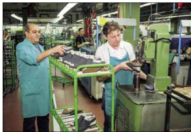
U pogonima Ivančice dnevno se proizvede 5.000 pari obuće

Uz dugogodišnju suradnju s austrijskom tvrtkom Paul Green na doradnim poslovima, Ivančica je koncentrirana na razvoj vlastitih robnih marki, Froddo i Bambi. U njihovu plasmanu fokusirani su