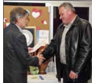
Zahvalnica kao mali znak pažnje ljudima koji niz godinama nose razvoj rekreacije