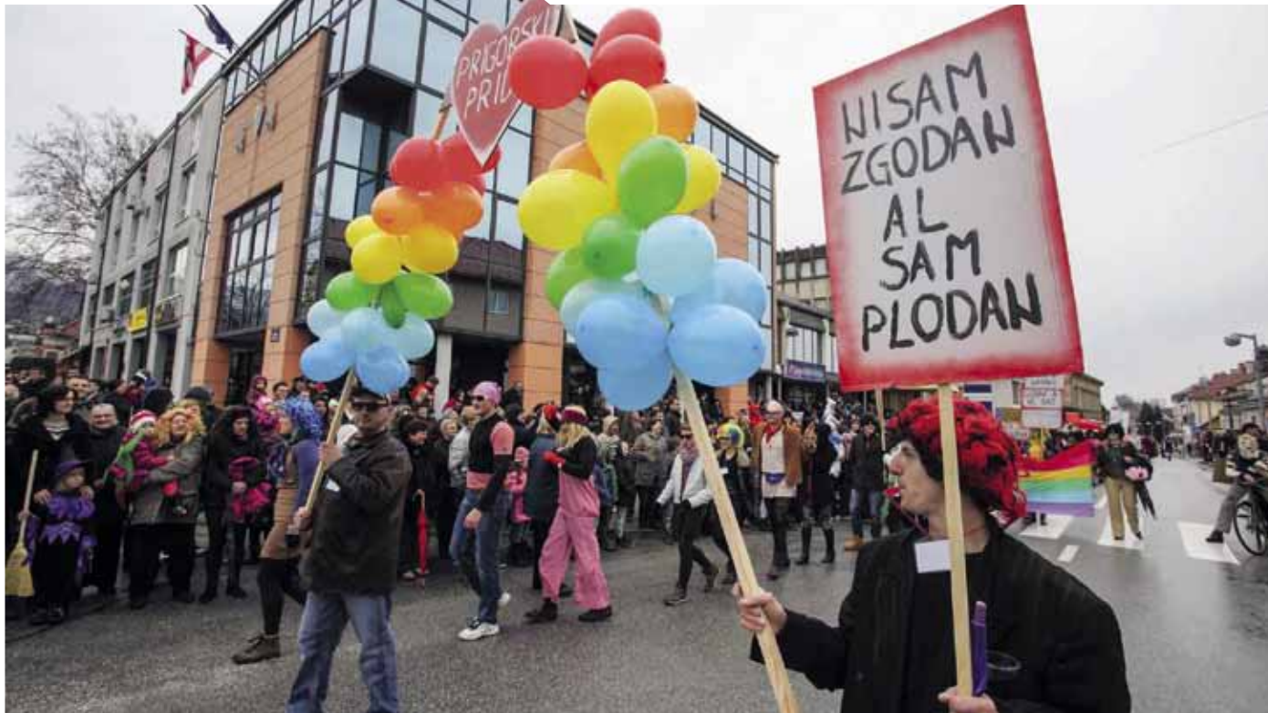
Pod maskama se nemilosrdno „briju“ aktualna društvena i politička zbivanja

te, živopisne maske iz Udruge tradicijskih običaja Pingo iz Cestice, uvijek originalne skupine iz Slovenije (Draženci, Leskovec, Videm), Udruga „Vredne roke“ iz Dragoslavca, kao i sku-