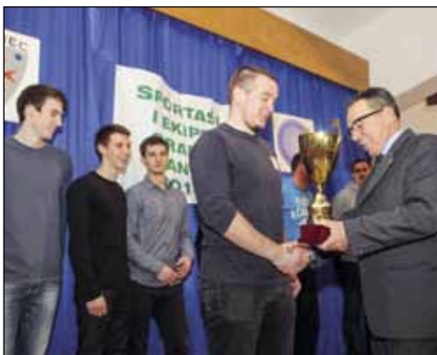
Rukometni klub Ivančica osvojio je naslov najbolje muške momčadi u 2013.

Želio bih da suradnja između ZŠU, udruga i pojedinaca bude što bolja, jer to je jedini način da svi možemo učiniti