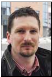
Piše: prof. Ilica Sever

Iako je sudbina sivog sokola uzela pozitivan zaokret, vrsta je na Crvenoj listi ptica Hrvatske označena kao rizična. U Hrvatskoj ga najviše ugrožavaju pesticidi, krivolov, a u novije vrijeme i uznemiravanje prilikom gniježđenja, posebno na liticama koje koriste sportski penjači. Naime, ženka će vrlo rano, na znak opasnosti, napustiti gnijezdo, nakon čega se jaja hlade, a zametkima prijete uigibanje. Posebno tražican slučaj dogodio se prije pet godina u Podrutama, kada je neupućeni sportski penjač namjerno „očistio“ staro gnijezdo, nakon čega taj par više nije imao mlade.