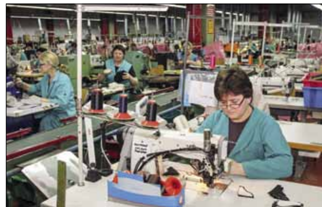
Nekadašnja velika fluktuacija u obućarskoj industriji danas je prošlost – radno mjesto se čuva, pa ma kako primanja bila skromna