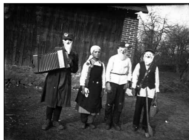
Skupina ivanečke djece u mačkarima

U fašničko vrijeme u Ivanu se spremala i prikladna hrana, ali o tome, kao i o još nekim specifičnostima autohtone ivanečke fašničke tradicije – nekom drugom prilikom.