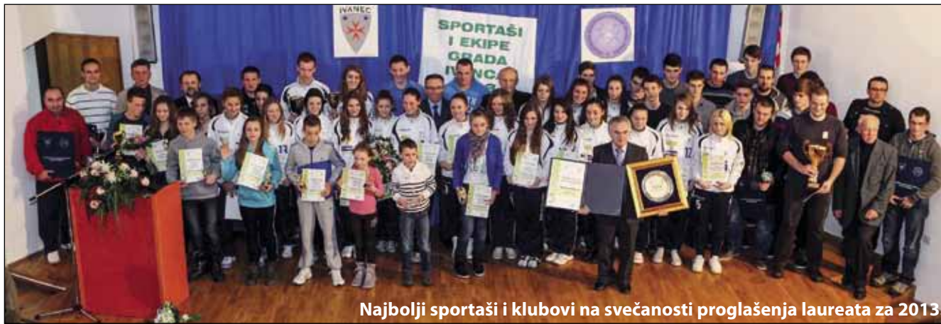
Najbolji sportaši i klubovi na svečanosti proglašenja laureata za 2013.