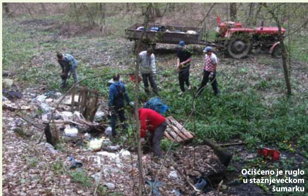
Očišćeno je ruglo u stažnjevečkom šumarku

MJESNI ODBOR I UDRUGA ZA ŠPORT I REKREACIJU STAŽNJEVEC