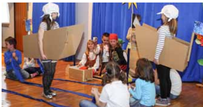
Ribice u Gusarskoj igri na uzburkanom moru

nagrađila sve sudionike, među njima i male goste iz susjednih vrtića u Lepoglavi, Klenovniku, Ladanju Donjem i Marčanu, koji