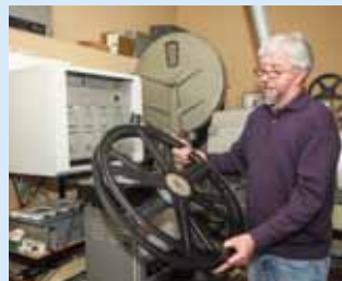
Donacija Ministarstva omogućit će digitalizaciju kina u Ivancu

Kao što je i prilikom svog prošlogodišnjeg boravka u Ivancu najavio zamjenik ministrice kulture prof. Berislav Šipuš, značajna novčana donacija osigurana je i župi sv. Marije Magdalene. Ministarstvo je, naime, prihvatilo sva njena četiri kandidirana programa te osiguralo 100.000 kuna za radove u ivanečkoj župnoj crkvi te još 100.000 kuna za radove u kapeli u Prigorcu. Povrh toga, izdvojilo je još 40.000 kuna za