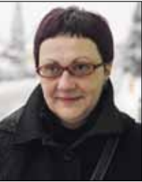
Piše: dr. sc. Suzana Jagić

žila se stoga što je pučanstvo ivanečkoga kraja na početku 20. stoljeća Ivanec nazivalo Ivanci, odnosno koristilo je naziv u množini, a ne jednini. U konkretnom slučaju, na pitanje „Odakle si?“, odgovor puka bio je „Iz Ivanec“, a ne „Iz Ivanca“, pri čemu je Ivanec kajkavski genitiv množine. Nadalje, na pitanje „Kamo ideš?“, odgovor je bio „Idem u Ivanec“, a ne „U Ivanca“. U svim odgovorima puk, dakle, upotrebljava množinu imenice Ivanec u različitim padežima, analogijom prema tome, za naziv mjesta koriste također množinu, točnije, nominativ