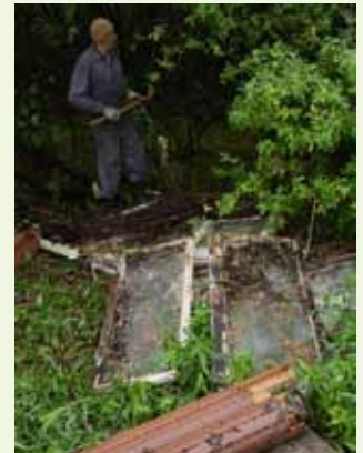
Među vrbe odložena su i prozorska krila

I on je bio sudionik ovogodišnje Zelene čistke koju je grupa mještana provela na području Jelenica, gdje su iz potoka