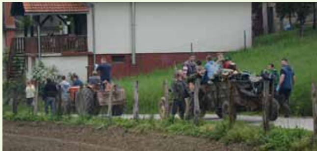
Odstranjen je otpad koji je „gušio“ potok Željeznicu

Procjenjuje se da su tri skupine akcijaša iz korita i okoliša potoka Željeznice izvukle više od 10 prostornih metara otpada