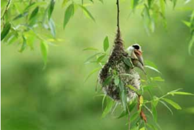
Sjenica mošnjarka, Remiz pendulinus , plete gnijezdo od paučine i trave