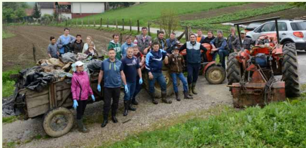
Masovan odaziv Zelenoj čistki mještana i mladih Ivanečke Željeznice