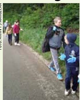
Učenici PŠ Margečan redoviti su sudionici zelenih čistki