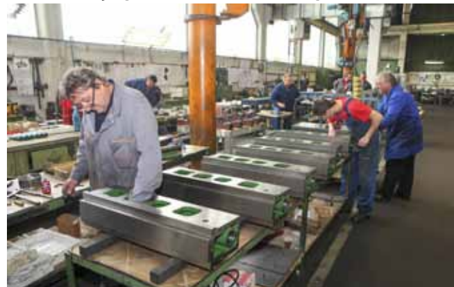
Proizvodnja u pogonu lake strojne obrade