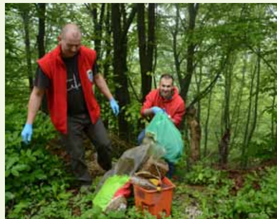
T. Friščić: Lokalitet ispod Sv. Duha koji smo očistili prije dvije godine ponovno je pun smeća