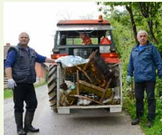
Skupljeni otpad s više lokacija na dogovoreno se mjesto prevezio traktorom

PLANINARSKI KLUB IVANEC I MJESNI ODBOR PRIGOREC Više od 50 akcijaša na tri lokacije skupilo velike količine krupnog otpada