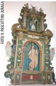
Oltar Krunice Majke Božje

Konzervatorski odjel u Varaždinu koji djeluje u sklopu Ministarstva kulture donio je rješenje kojim je pod preventivnu zaštitu stavio vrijednu povijesno – kulturnu baštinu u kapeli Sv. Duha u Prigorcu. Riječ je o glavnom oltaru Svetoga Duha te o oltaru Krunice Majke Božje. Oba su oltara drvena, rezbarena, polikromirana i pozlaćena, a datiraju iz 17. stoljeća. Iz istoga je doba i slika