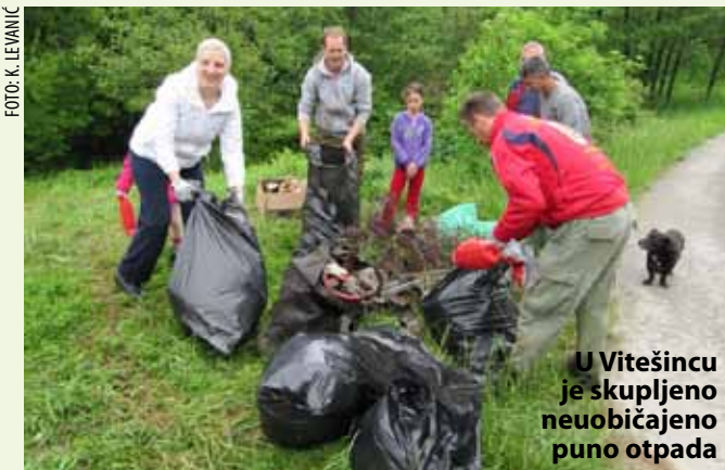
U Vitešincu je skupljeno neuobičajeno puno otpada

MJESNI ODBOR VITEŠINEC Opsežna zelena akcija na širem području Vitešinca