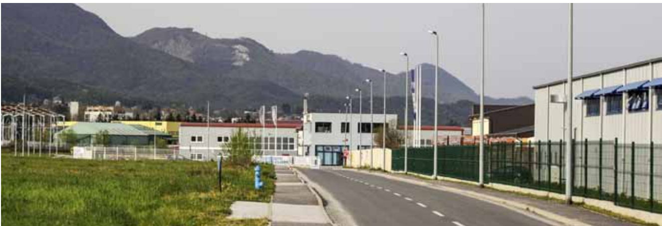
Da su predstavnici austrijskih ulagača doista došli, Grad bi im ponudio zemljište i sve beneficije u zoni SA SJEDNICE GRADSKOG VIJEĆA Rasprava na aktualnom satu