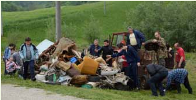
Škriljevčani su imali posla preko glave, ali – isplatilo se!

kazala je i golema hrpa krupnog otpada što su je sudionici skupili i za odvoz pripremili uz cestu nedaleko od igrališta.