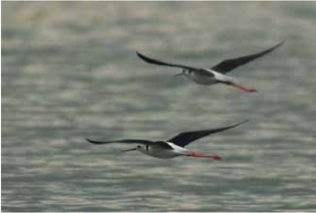
Par vlastelica Himantopus himantopus prelijeće Pionirski bajer

Zanimljivo bi bilo čuti što o tome misle Ivančani na počet- ku 21. stoljeća.