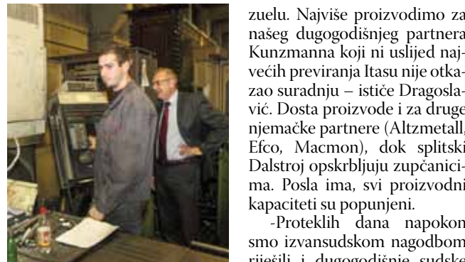
Za većinom strojeva mladi su radnici, u ranim dvadesetim godinama