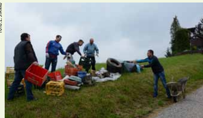
Mjesni aktivisti tačkama su dovezli otpad što su ga pronašli na pojedinim lokalitetima

–Akcijaši su se posla prihvatili u dolini od Šimeka i prema Joseku te odatle izvukli ovo smeće. Dobro je, nema ga previše! Ovdje, naime, većina ljudi