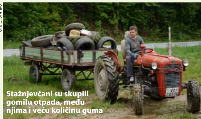
Stažnjevčani su skupili gomilu otpada, među njima i veću količinu guma

Nekoliko prikupljenih „kubika“ otpada mještani su natr-