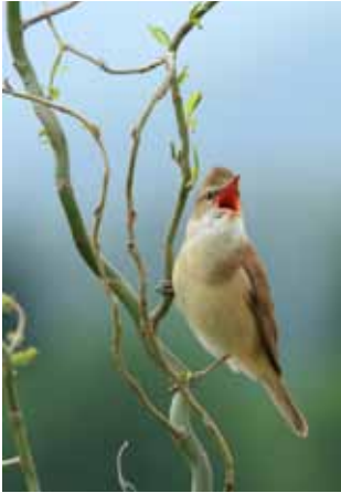
Veliki trstenjak, Acrocephalus arundinaceus . pje- va svoj poznati kri.. kri.. kara.. kara.. krek.. krek