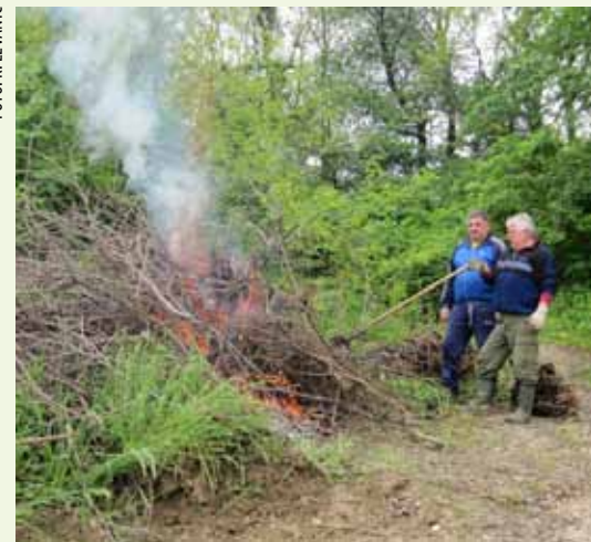
Skrajski pajdaši uređivali su okoliš nadstrešnice i stare preše na Šatornjaku

SALINOVEC U zelenoj akciji sudjelovali mještani te udruge rekreativaca, vinogradara i gljivara