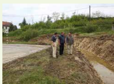
Zapušten kanal ureden teškim strojem