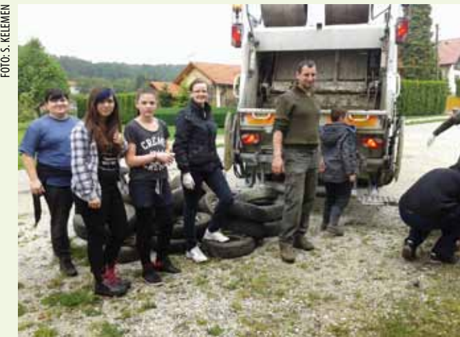
Gume, metal, staklo, plastika – tomu nije mjesto u prirodi MJESNI ODBOR CERJE TUŽNO I UDRUGA OKOLIŠ