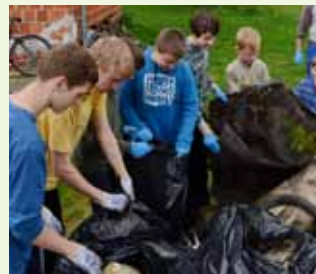
I mlade lukavske snage sudjelovale su u akciji

Slijedom već ustaljenog običaja, Lukavčani su se nakon provedene akcije nastavili družiti u mjesnom društvenom domu, uz odlacan grah što su ga i ove godine pripremili za sve sudionike svoje Zelene čistke. (ljr)