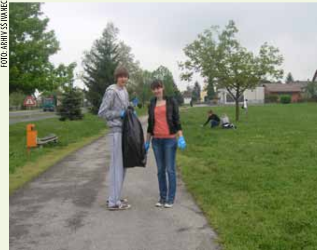
Ivanečki srednjoškolci – volonteri pokupili su sitni otpad na potezu od dječjeg vrtića do autobusnog kolodvora

Volonterskim uključivanjem u akciju ivanečki su gimnazijalci jasno izrazili svoj stav prema očuvanju okoliša i pokazali da će kao mladi, obrazovani i ekološki osviješteni ljudi i ubuduće promicati i u svakodnevnom životu štiti vrijednosti života u čistoj prirodi.