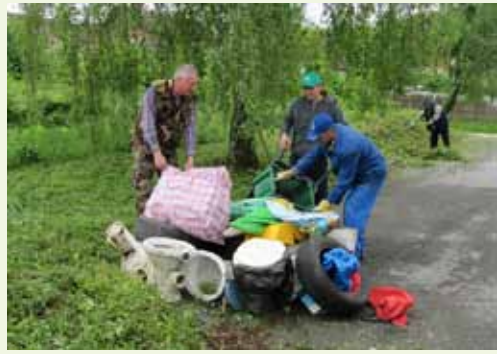
Mještani Punikvi svom su naselju poklonili slobodno vrijeme i proveli odličnu akciju

K tomu, na krovu doma izmijenjen je dio starih crjepova i „pokrpana“ mjesta na kojima je prokišjavao, a Strmečki najavljuje cjelovitu akciju uređivanja unutrašnjosti doma, s ciljem njegova stavljanja u društvenu funkciju. (ljr)