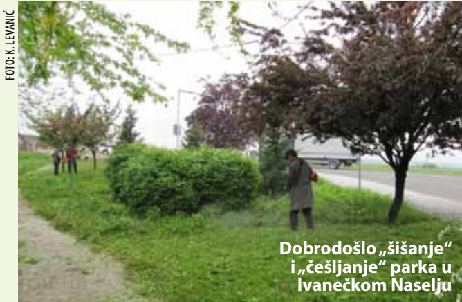
Dobrodošlo „čišćanje“ i „češljanje“ parka u Ivanečkom Naselju