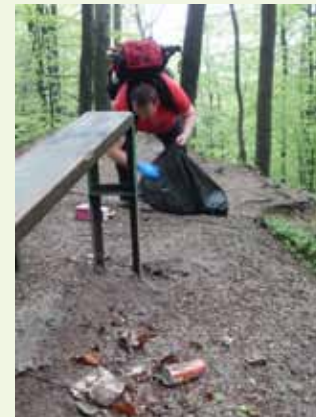
Mnogi kažu da vole Ivančicu – ako je tako, onda na planini neka za sobom ne ostavljaju svoje smeće

Većina smeća, među njime i nešto krupnijeg, skupljena je oko Žganog vina (uglavnom otpada što su ga ostavili izletnici koji na tom lokalitetu rado spremaju roštiljade), a još podosta sitnog smeća (većinom maramica, boca i omota) prikupljeno je na sa-