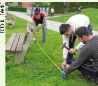
Sve mora „štimiti“ u centimetar (gore) Kopati rupe, pilili građu i oblikovati ogradu

MJESNI ODBOR PUNIKVE Iz šume uklonili divlje odlagalište