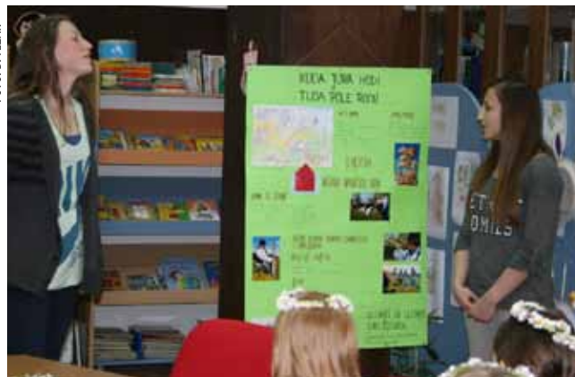
Prezentacija rezultata istraživanja o jurjevskim običajima našega kraja