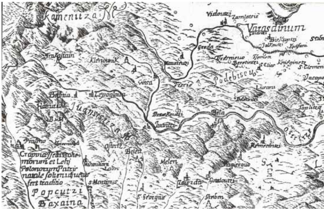
Prva potpunija karta središnje Hrvatske izvan turskih osvajanja, Stjepan Glavač, 1673. g.

Jedno od objašnjenja za ko- rištenje naziva u množini dugo- trajan je život ljudi u proširenim obiteljskim zajednicama, odno- sno, kućnim zadrugama, kao i općenito, brojnost pučanstva na prostoru sjeverozapadne Hrvatske. Množina je za pu- čanstvo stoga simbolizirala analogijom prema tome, za naziv mjesta koriste također množinu, točnije, nominativ