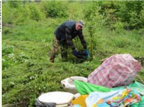
Uređen je i okoliš društvenog doma