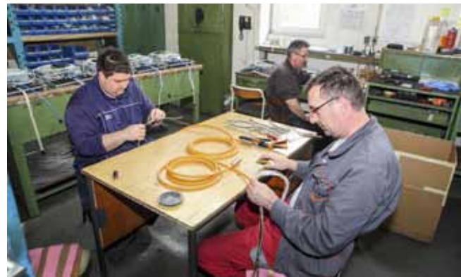
Izlazak iz krize - Itas ima sve pretpostavke za širenje i novo zapošljavanje