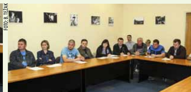
Gotovo da nije bilo sredine koja na sastanak nije poslala svog predstavnika

tvrtke koja je odradila sav posao oko prihvata i zbrinjavanja otpada s brojnih lokacija na kojima se provodila Zelena čistka. (ljr)