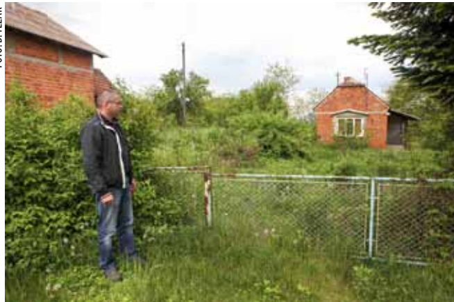
Vlasnici se često oglašuju na obvezu da kose travu i uklanjaju šikaru i živicu

Na neizgrađenom građevinskom zemljištu, u dijelu naselja Ivanec omeđenom Kovačicevom, Malezovom, Rajterovom ulicom (spoj Malezove i Kukuljevićeve ulice) te Kukuljeviće-