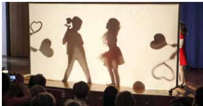
Sjajnom igrom sjena radovanski su klinci izmamili buran aplauz brojne publike

Posjetitelji koji su toga dana prepunili srednjoškolski amfiteatar doista su samo mogli uživati u vedrom programu i dobrim emocijama što srca odraslih pune uvijek kada na bini sigurno, spontano i sa širokim smijehom nastupaju najmlađi, oni