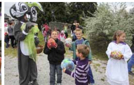
U društvu Uskrsnog zeca Jure

Ivančice koji su oslikavali golemu jaju, u parku trgalici sa pisanicama, zabavili se raznim igrama... A sve to u društvu Uskrsnog zeca Jure i njegove pratilje Slatkice koji su se male-nima ove godine pridružili prvi