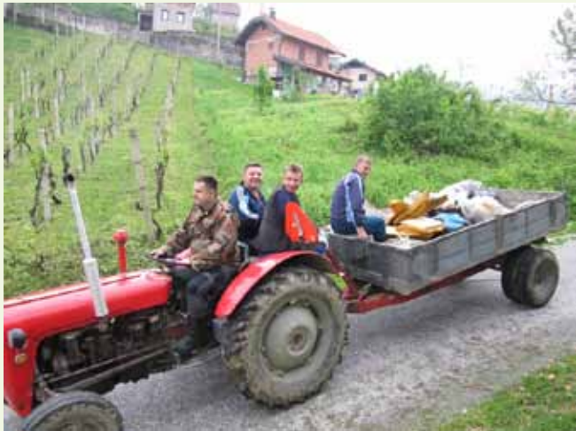
U obilasku terena fotoobjektivom smo zahvatili i dio akcijaša s s područja Lančica-Knapića

Uspješan završetak akcije mještani rekreativci začiniili su ručkom – svi kažu da je grah majstora Slivara bio vrhunski – i dobrom kapljicom ispod nadstrešnice na Skradnjaku. (ljr)