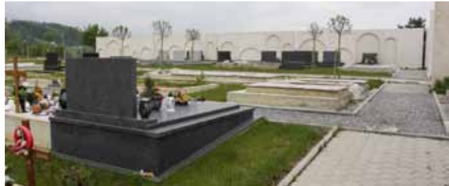
Zbog stalnih kiša i nestabilnog vremena u travnju, korov na grobljima nije se mogao redovito tretirati herbicidima

-Netočno je također da se iz Ivanca na posao u Prelog dnevno vozi autobus radnika. Volio bih da mi nadete sve te ljude i pitate ih kolike su putne troškove dobili – replicirao je Lančić. (ljr)