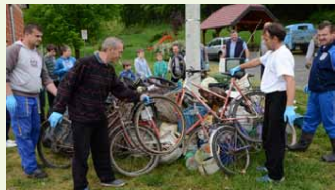
Mještani su rado pokazali svoje „trofeje“, među njima i biciklističke „kosture“

Mnoštvo akcijaša, kojima su se pridružili i osnovnoškolci, prikupljen su otpad sortirali ispred mjesnog društvenog