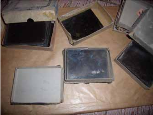
Negativi na staklu

Spomenimo tek da počeci fotografije u našem kraju da- tiraju iz 19. stoljeća kada su se njome, iz vlastitog zadovoljstva i interesa, počeli baviti trako- šćanski grofovi Juraj i Karlo Drašković. Uz Juraja spominje se godina 1855. i kalotipijski negativi na kojima se nalazi dvorac Trakošćan, portreti i ostali motivi, osim mrtve pri- rode. Fotografska preokupacija Karla Draškovića (1873.-1900.) bazira se na slobodi izabranih motiva. Pretendira fotografi- ranje naših ljudi i krajeva (na-