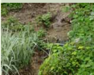
Vodonosa je i po nekoliko puta dnevno morao s vrcem odlaziti na izvor po frišku vodu

Inače, prema usmenoj predaji, izvor se održava još od 15. stoljeća, jer s njega su se nekad davno vodom opskrbljivala gospoda koja su živjela u kaštelu Staroga grada. Predaja kaže da je vodonosa, koji je bio zadužen za opskrbu pitkom vodom, i po nekoliko puta dnevno odlazio s glinenim vrcem do izvora po svježu vodu. Postoji i objašnjenje zašto se po vodu išlo baš na to, nešto udaljenije mjesto, premda je izvorište Lješkovec bilo bliže, pokraj ceste prema Prigorcu i Ivančici, a odličnom je vodom snabdijevalo šire pučanstvo.