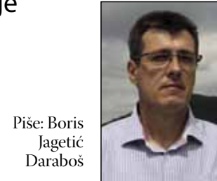
Piše: Boris Jagetić Daraboš

Koncentrirano, s jasnom vizijom, odabirao je kadrove koje će snimiti. Njegove sli- kovne produkcije izrazito su kvalitetne za ondašnje vrijeme. Nameće se zaključak da je bio upućen u svjetska fotograf- ska kretanja, a raspolagao je i kvalitetnom opremom. Kasni- je, u 20. stoljeću, pojavljuju se mnoge naše eminentne osobe koje se profesionalno i amater-