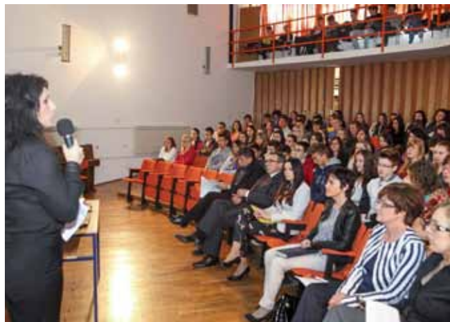
GRAD I SREDNJA ŠKOLA Tim Grada Ivanca učenicima Ekonomske škole prezentirao temu prepoznatljivosti Ivanca kao business friendly sredine

Za razliku od niza prethodnih godina, kada je resorno ministarstvo kandidirane projekte s područja grada Ivanca financiralo vrlo skromno ili ih posve zaobilazilo, rezultati vrednovanja projekata iz Programa javnih potreba za 2014. pokazuju da Ministarstvo kulture prepoznaje i valorizira kvalitetne ivanečke programe te pritom uvažava i realne potrebe našega kraja. (ljr)