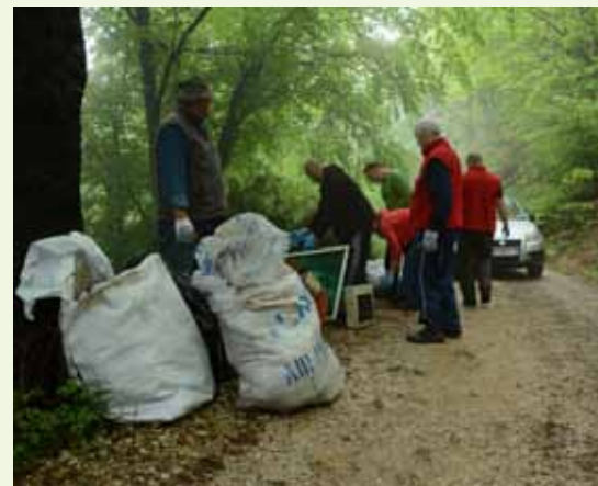
Planinari su za odvoz pripremili nekoliko „kubika“ krupnog otpada