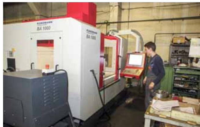
Strateški cilj – proizvesti novi, vlastiti proizvod

-Naš glavni proizvod još je uvijek ono u čemu smo najbolji, a to su alatni strojevi i strojni dijelovi. Izvozimo 90 posto, najviše u Njemačku, Italiju i Vene-