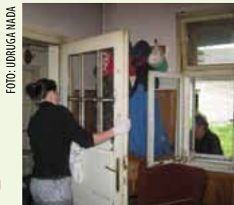
Čišćenje kuće i uređenje dvorišta stvari su koje puno znače bolesnima i starima

Ivanečka Udruga udomitelja Nada pokazala je da Zelena čistka, osim ekološkog, može imati i naglašeno humano lice. Na preporuku Centra za socijalnu skrb, odrasli udomitelji i udomljena mladež posjetili su jednog bolesnog čovjeka u Prigorcu te mu pokosili cijelo dvo-