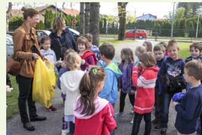
Učenicima nije trebalo dvaput reći - rado su se družili na otvorenom i sudjelovali u akciji

uključili u Zelenu čistku. U razdoblju od 22. do 25. travnja, svaki je razred po jedan školski sat proveo na otvorenom, čisteći od sitnog okoliša krug škole i gradske ulice. Đaci-putnici pak su svoja autobusna stajališta oslobađali od papirića i vrećica raznih grickalica i slatkiša.