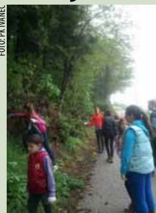
Mladi su skupljali smeće pokraj staza ispod Svetog Duha

-Naša je čistka završila u 11 sati i čini nam se da je ove godine smeća manje. Uz malo dobre volje, ovo je bio naš doprinos čišćenju okoliša i raduje nas što smo time ponovo bili dio velike volonterske