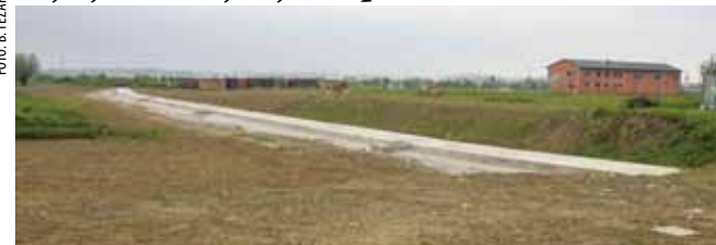
Cesta će se graditi iznad potoka Matačine koji je lani zatvoren armiranobetonskim cijevima

✦ Riječ je o atraktivnom poslovnom području uz obilaznicu, koje je namijenjeno proizvodno – industrijskoj namjeni