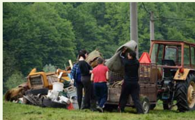
Otpad je skupljen i za odvoz pripremljen blizu igrališta

Stažnjevečka „zelena patrola“ potom je druženje u dobrom raspoloženju nastavila na prostoru igrališta Vinski potok u Stažnjecu. (ljr)