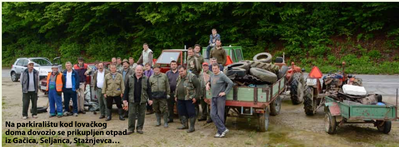
Na parkiralištu kod lovačkog doma dovezio se prikupljen otpad iz Gačica, Seljanca, Stažnjeva...

MARGEČAN Gužva kod Lovackog doma Šumskog zeca na dan Zelene čistke