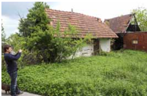
Komunalni redari počeli su obavljati nadzor nad provedbom gradskih odluka

Posebno naglašavamo da je zabranjeno poduzimati bilo kakve radove ili radnje na nerazvrstanoj cesti i u njenom zaštitnom pojasu bez suglasnosti gradskog Upravnog odjela za urbanizam, komunalne poslove i zaštitu okoliša.