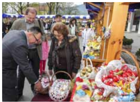
Umjetnički oslikanim pisanicama nisu mogli odoljeti ni gradski čelnici

Po običaju, KUD-ovi su izložili tradicijske rukotvorine i ukrase, pisanice oslikane na način naših djedova i baka te sve to ukasili specijalitetima narodnog uskrsnog stola – sunkom, kosanom masti, domaćom slaninom i kobasicama, mladim lukom, slatkim delicijama. Toj mirisnoj starinskoj gastro-ponudi s druge su strane „prkosili“ moderniji štandovi s pisanicama