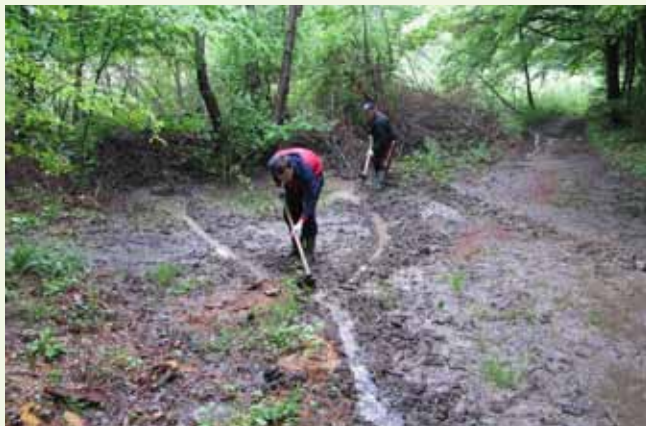
Voda i blato rade probleme na stazi što je trkači koriste za svoje utrke, pa ih treba pročistiti

Uredili su i cross stazu koju koriste za organizaciju trkačke lige, a koju za svoje temeljne pripreme inače koriste i drugi sportski kolektivi našeg grada. Akcijaše je razveselio i posjet gradonačelnika M. Batinića sa suradnicima, s kojim su ujedno razgovarali o budućem uređenju prostora Jezera. (ib)