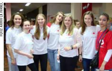
Ekipa Srednje škole Ivanec predstavljat će našu županiju na državnom natjecanju

Ekipa Srednje škole Ivanec pobjednica je 6. međuzupanijskog natjecanja ekipa prve pomoći mladih Hrvatskog Crvenog križa održanog u Hodošanu.