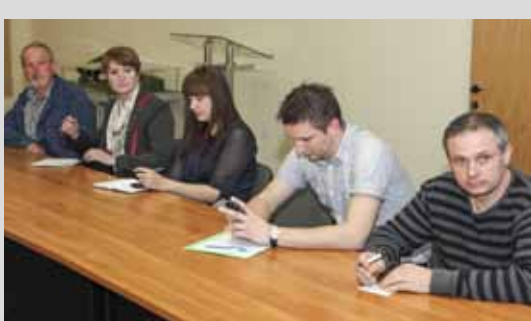
Uoči svih izložbi i manifestacija, Grad okuplja udruge i konzultira se s njima

Uskrsna izložba - lijepo predblagdansko druženje i doživljaj za velike i male