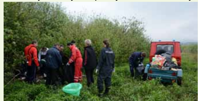
Akcijaši su uklonili mnogo otpada s livada ispod Poje

Sudionici akcije sve su prikupljeno smeće skupili i sortirali kod rezervoara u Vuglovcu te ga pripremili Ivkomu za odvoz. Uključivanjem u akciju, mladi su ujedno jasno izrazili svoj ekološki stav i naglasili potrebu čuvanja prekrasne prirode vuglovečkog kraja. (ljr)