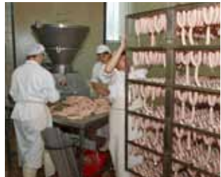
Industriji mesa ostaje struja i voda kako ne bi propale zalihe u hladnjačama

politička korupcija, tvrtke mogu potpore dobiti samo temeljem mjerljivih kriterija, nikako drukčije. U međuvremenu sam primio predstavnice sindikata IMI-ja. Dogovorili smo da će Grad dostaviti popis radnika kako bismo im prolongirali naplatu gradskih davanja, a s HEP-om i Ivkomom je dogovoreno da se tvrtki ne isključuju struja, odnosno, voda, kako ne bi propale zalihe robe u hladnjačama. (ljr)