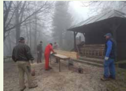
Planinari su postavili nekoliko novih klupa... .... i uredili stepenice iza depandanse

mim stazama. No, zna se da planinari najviše posla imaju nakon 1. svibnja, kada Ivančica tradicionalno bilježi najveću posjećenost te, na žalost,