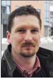
Piše: prof. Ilica Sever

na zbog isušivanja i širenja poljoprivrednih područja i prenamjene zemljišta u dru- ge svrhe. Stoga su diljem Eu- rope ribnjaci i slični vodeni objekti i akumulacije posta- la obitavališta močvarica kojima su nestala prirodna staništa.