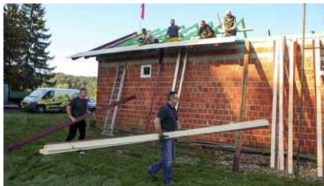
I gradski čelnici pridružili su se radnoj akciji