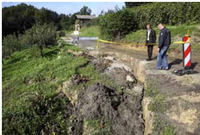
Klizišta u Margečanu obišao je gradonačelnik Č. Bračko s gradskim službama

Prema procjenama Gradskog povjerenstva za procjenu šteta od elementarnih nepogoda, šteta na ukupno deset većih klizišta procijenjena je na 1,72 milijuna kuna. Na novom klizištu u Ulici Biškopovec u Margečanu klizište površine 450 četvornih metara oštetilo je nerazvrstanu cestu u vlasništvu Grada, a procjena štete je 326.000 kuna. Nizbrdo je „krenuo“ još jedan dio ceste u istoj ulici, površine 350 „kvadrata“, gdje se šteta procjenjuje na go-