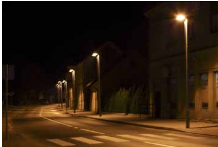
... i nova štedna rasvjeta, snimljena nakon 23 sata, kada se cijeli Ivanec prebacuje na polunočni režim potrošnje

2007. godine 1.000 tona krupnog otpada, 2013. – 13,5 tona