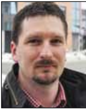
Piše: prof. Ivica Sever

ponekad, ptica. Otrovni ugriz poskoka, ako se ne liječi, može imati ozbiljne posljedice, a u nekim slučajevima i smrtan ishod.