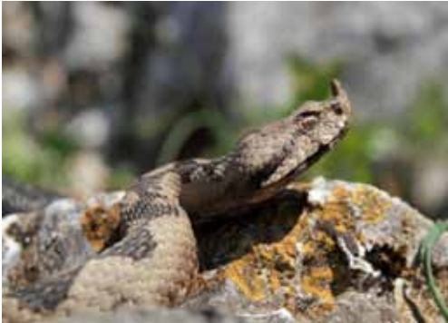
Poskoka prepoznamo po tipičnom „roščiću“

Poskok, Vipera amodytes L. jedina je otrovnica koja obitava u našem kraju. Živi na osobitim staništima koji su mješavina kamenjara i suhih toplih travnjaka ili šikara. Možemo ga susresti na istočnim i zapadnim obroncima Ivančice te na južnim padinama, dok ga na sjevernoj padini Ivančice uglavnom nema. Potencijalna staništa su travnati dijelovi grebena Konja i Stričeca, o čemu svjedoči nalaz iz 2012. No, kako se radi o relativno siromašnom staništu, broj mogućih jedinki je vrlo malen. Prehrana poskoka sastoji se od glodavaca i guštera te