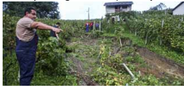
Veliko klizište na Skradnjaku „pomelo“ je više od 300 neobranih trsova

u Cvjetnoj ulici, a nove procjene kažu da će popravak stajati više od 220.000 kuna.