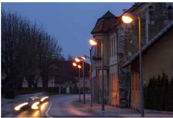
Stara rasvjeta u Malezovoj s klasičnim svjetiljkama...

Stigao je novi asfalt na dionicu županijske ceste u Osečkoj