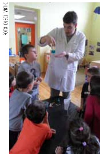
Zabavno eksperimentiranje s uljem, čokoladom, Gustinom

Radionica Ki bi gori, sad je doli, provodila se s djecom u dobi od pet i šest godina, koja su uživala koristeći epruvete, kapalice, staklene čaše. Tema radionice bila je Gustoća, a pokusima kao što su duga u epruveti i mjehurići u čaši, maleni su itekako dobro shvatili pojam gustoće kroz njima bliske pojave kao što su gusta juha, gusti sok i sl. Poučno i pohvalno.