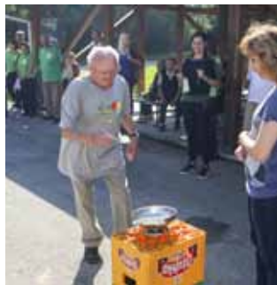
Kad ruke drhte, ovakva akcija pravi je podvig!

„Nastojimo naše korisnike uključiti u razne aktivnosti koje