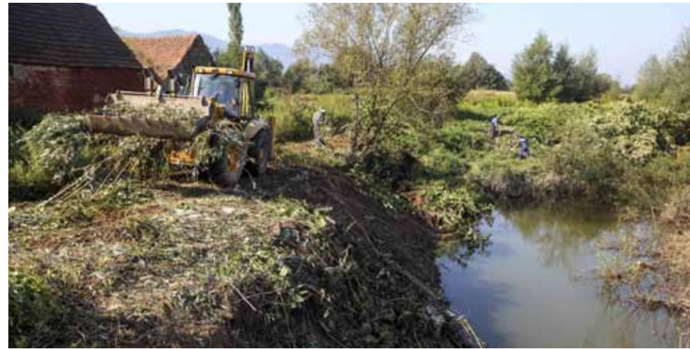
Nakon dovršetka radova, Bednja više neće poplavljivati privatna imanja i prometnice

Poznato je da su proteklih godina na rješavanju ovoga pro-