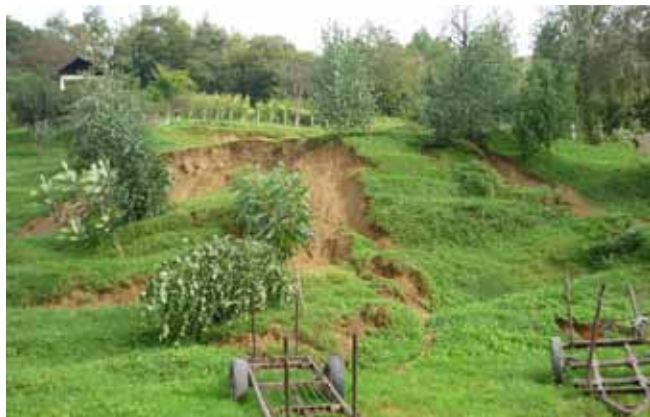
Klizišta su se aktivirala na cijelom području grada Ivanca

tovo 195.000 kuna. Na području Margečana reaktiviralo se i veliko klizište (600 „kvadrata“) u Cvjetnoj ulici, a nove procjene kažu da će popravak stajati više od 220.000 kuna.