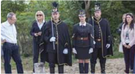
Članovi Rudarske čete na međunarodnoj manifestaciji u Istri

Članovi čete u Istri su aktivno sudjelovali u službenom programu te polučili znatizeljnu