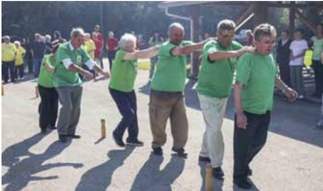
Natjecatelji nisu dopustili da im poodmakla dob bude prepreka za zabavu

u grupno vježbanje i razne društvene igre. Poznato je također da im je u domu na raspolaganju i posebna soba za opuštanje, koja naročito blagotvorno djeluje na osobe s demencijom – kazao je ravnatelj Jalšovec.