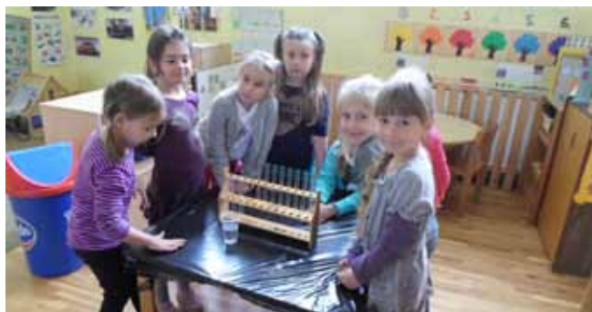
Kemija za najmlađe

Stoga i ne treba čuditi što su eksperimenti naslovljeni kao Vulkan, Ljigavac i Crtanje po mlijeku, djecu mlade dob-