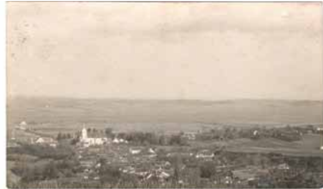
Razglednica Ivanca, izdavač HPD Ivančica

Iznimno su rijetke slikovne produkcije iz tog razdoblja, pa čak i iz puno većih mjesta i gradova (Zagreb, Varaždin). Srećom, danas djeluju pojedinci i stručno profilirane skupine koje istražuju i skupljaju isključivo kartofilsku građu iz razdoblja 1941.-1945. Tomu u prilog ide i poledina rijetke razglednice (fotografija u prilogu, s natpisom Ivanec) koja ima poštansku marku od 2 kn, a koja se zbog svog lica i naličja može smatrati raritetnom.