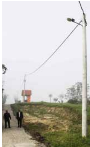
U Osečkoj su montirane svjetiljke na 24 stupa

jetljena, pa vjerujem da je to veliko olakšanje prvenstveno radnicima i srednjoškolicima koji se kući vraćaju u večernjim satima. Dosad su, naime, nakon silaska s autobusa na stanicu u Margečanu, mještani prema Osečkoj pješčili nerasvijetljenom cestom. Slično je u Čovranima,