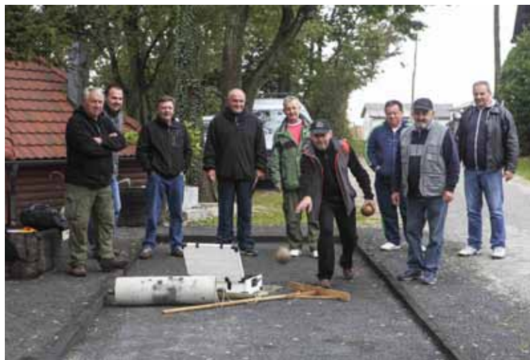
Boća se balotama od prije 50 godina, izrađenim od korijena crnike

-Nije to neko profesionalno bočalište, već prostor za igru u narodnom stilu. Po- bjeđnički par osvojiti će prijelazni pehar, a