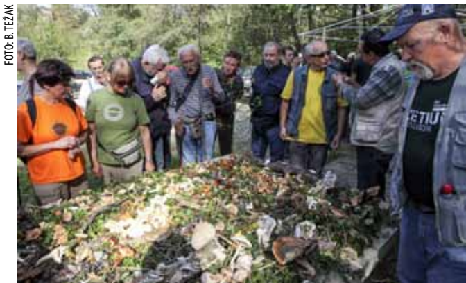
Među osamdesetak izloženih vrsta bilo je i onih o kojima upozorenja nikad dosta

GLJIVE (NE) RASTU Stotinu gljivara na 1. međunarodnoj gljivarijadi u Ivancu