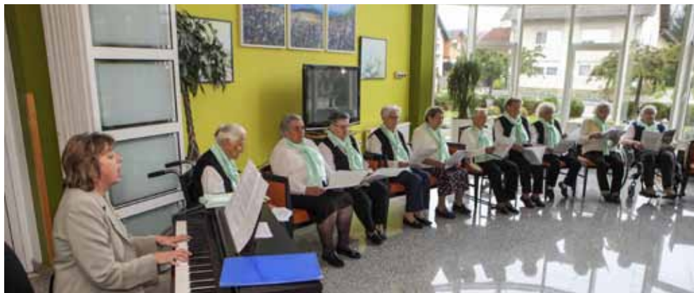
U povodu Međunarodnog dana starih, korisnici izveli program ispunjen pjesmom

Isto tako, zatraženo je od HC-a da riješi problem uključivanja u promet kod mosta uz potok Vuglovčak (prema bajerima) koji najviše koriste ribiči i vlasnici poljoprivrednih površina. Naime, građani se žale da im je, nakon izvedenih radova