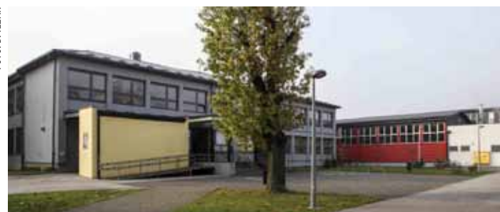
Natječaj za dogradnju škole otvoren je do 19. studenog

Rok za podnošenje prijava i iskazivanje interesa je do 19. studenog. Objekti će se graditi, odnosno, dogradivati s ciljem stvaranja uvjeta za održavanje jednosmjenske nastave i postizanja kvalitetnijeg obrazovanja. Traži se privatni partner koji će u roku dvije godine moći izgra-