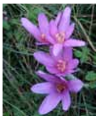
Buketić mrazovca – jedan od tisuću

Još jednom, nažalost, promjena načina života dovela je