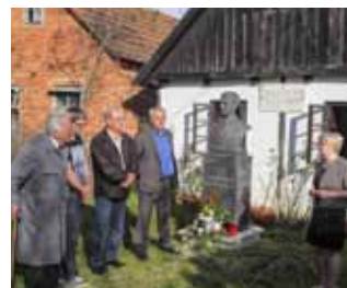
Antifašisti su položili cvijeće pokraj Kraševe biste

U kratkom obraćanju okupljenima, zamjenik gradonačelnika Čedomir Bracko obnovio je