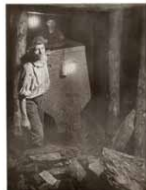
OtokarHrazdira, umjetnička fotografija rudara u rudniku, objavljena u prvom broju Galerije 1933.

U nastavku nešto o nekadašnjem ivanečkom časopisu Galerija, mjesečniku internacionalne fotografije (jugoslavensko izdanje).