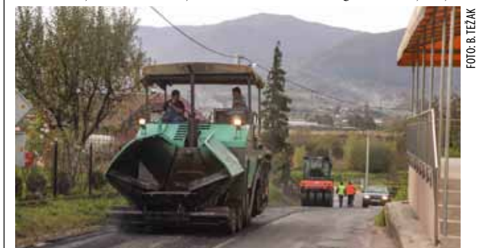
Novim asfaltom presvučen je i kolnik na ulazu u naselje

onica koju je svojedobno ugrozilo klizište. Po riječima ravnatelja Županijske uprave za ceste Tomislava Osonjačkog, obavljene radovi vrijedni su oko 100.000 kuna, a financirani su iz sredstava redovitog održavanja. (lir)