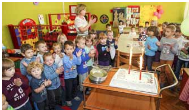
Stigla je torta i za pačice i zvončice u Radovanu

U ivanečkom vrtiću male-ni su, zajedno sa svojim tetama, središnju proslavu s gromo-