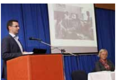
Ivanec je bio domaćin državnog skupa školskih knjižničara

Potporu održavanju skupa dali su Ministarstvo kulture i Grad Ivanec.