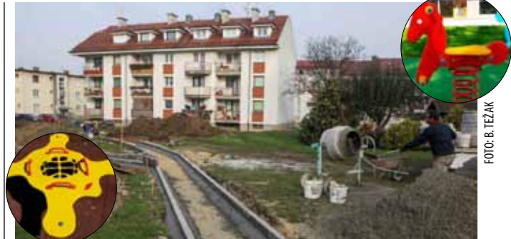
Uređuju se staze, a ove godine stižu ljuljačke, vrtuljak...

u posljednjih pet godina imaju više od 150 milijuna kuna prihoda – naglasio je župan te dodao kako će se drugi krug natječaja