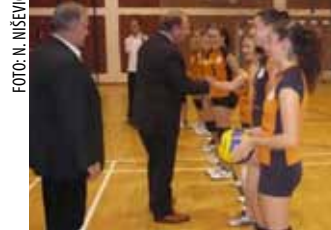
Čelnici Odbojkaškog saveza predali loptu s potpisima svih igračica reprezentacije

potpisom svih igračica hrvatske reprezentacije koja je nedavno uspješno sudjelovala na Svjetskom prvenstvu u Italiji. Sjajnu igru odbojkašice Ivanca nastavile su i u Varaždinu, gdje su ekipu Varaždin Volley IV pobijedile rezultatom 3:0 u setovima. Ekipa Ivanca na prvenstvenoj je tablici prva s 9 osvojenih bodova, a sljedeću utakmicu igra 8. studenog s ekipom Ludbrega.(nn)