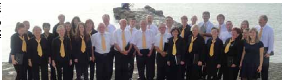
Ivanečki zbor ponovno se vinuo među zlatne hrvatske zborove

Ove godine ivanečkog glazbeno stvaralaštvo bilježi svoje vrhunce. Pokazuje to i podatak da su čak tri ivanečka KUD-a, uz KUD Rudolfa Rajtera i KUD Salinovec te Vokalni ansambl Sakcinski, izborili naslov pobjednika županijskih smotri te na državnim smotrama zastupaju