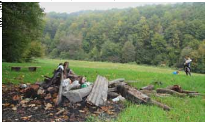
Nakon obiteljskog roštilja u prirodi Šuma