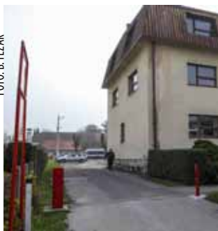
Razbijena rampa kod vatrogasnog doma

gija te ih uputiti u pravila ponašanja na društvenim mrežama s naglaskom na zaštitu osobnih podataka i privatnosti. Želimo da djeca prepoznaju opasnosti koje im prijete i da samim time izbjegniju rizične situacije te potaknuti eventualne žrtve na prijavljivanje kaznenih djela – kazao je Divjak. Time će se baviti i posebna županijska Zaklada za prevenciju kriminaliteta koja bi se financirala iz donacija Županije, gradova i općina, poduzetnika i građana.