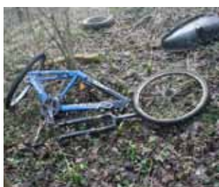
Iz policijskog arhiva: Rastavljeni na dijelove - česta sudbina ukradenih bicikala