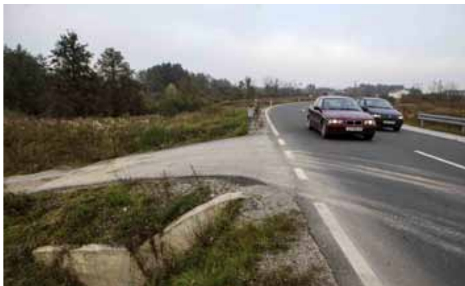
Od HC-a je zatraženo da riješi problem uključivanja u promet na DC kod mosta uz potok Vuglovčak (prema bajerima)

To je na sjednici Vijeća za prevenciju Grada Ivanca održanoj u Gradskoj vijećnici u petak, 17. listopada, pod predsjedanjem zamjenika gradonačelnika Čedomira Bračka, izja-