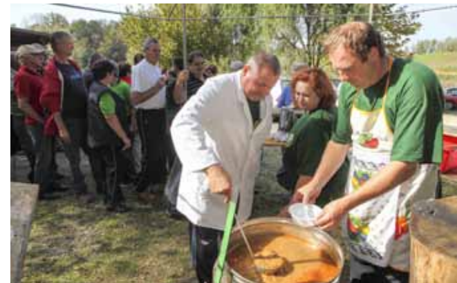
Čak 35 vrsta gljiva krčkalo se u gljivarskom kotliću

Ovogodišnju manifestaciju je poduprla Turistička zajednica Grada Ivanca (ljr)