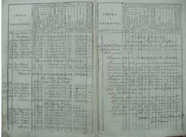
U vizitaciji župe 1649. nabrojeno je 13 sela na području današnjega Ivanca

U Vitešincu su tri zadrugne kuće nosile prezime Krog, dvije Hudobec i jedna Grahovec (vje-rojatno Grabrovec). U Prigorcu je šest zadrugnih kuća nosilo prezime Harjač (Herjač), po