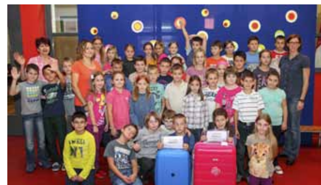
Učenici su kofere napunili odjećom i higijenskim priborom

Akcija je provedena u Dječjem tjednu, od 6. do 10. listopada, pri čemu su djeca iz DND-a i učenici s puno brige i truda novom odjećom i priborom za održavanje higijene napunili kofere za dvije spomenute djevojčice.