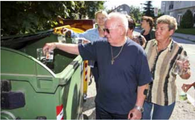
Grad je reagirao na zahtjeve građana te od Fonda zatražio potporu za nabavu dodatnih 68 spremnika za odvojeno prikupljanje otpada

OTPAD Grad Ivanec pokrenuo aktivnosti u cilju što kvalitetnijeg gospodarenja otpadom