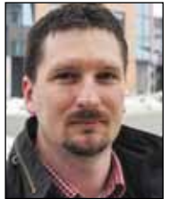
Piše: prof. Ivica Sever Slap potoka u jesenskom izdanju