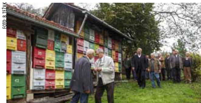
Karlovački pčelari u Bedencu

društva Varaždin, koji na svom imanju u rodnom Bedencu vodi uzornu brigu o 60-ak košnica. Svoja znanja prošlog je mjeseca podijelio s članovima Pčelarskog društva iz Karlovca koji su obišli njegov pčelinjak te se raspitali o iskustvima svoga domaćina u uzgoju pčela i proizvodnji meda u ovoj godini. A ona je, zbog lošeg vremena, i za pčelare u cijeloj Europi bila nezapamćeno loša te, među ostalim, rezultirala akutnim nedostatkom (i poskupljenjem!) kvalitetnog meda na tržištu. Inače, S. Špiranec povjere-