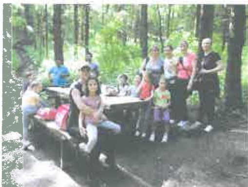
-druženje djece i roditelja na „Ivanščici”