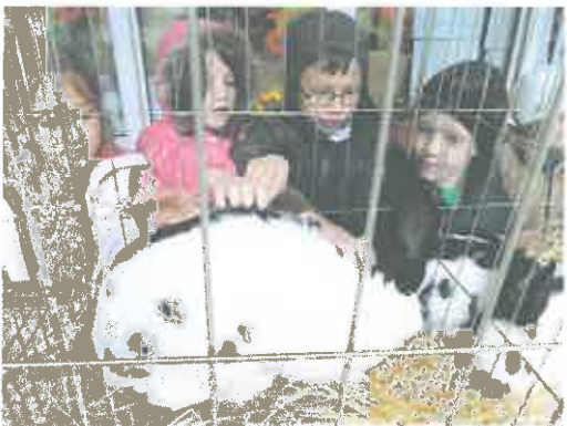
- povodom Uskrsa posjeta Društva uzgajatelja malih životinja „Fauna“