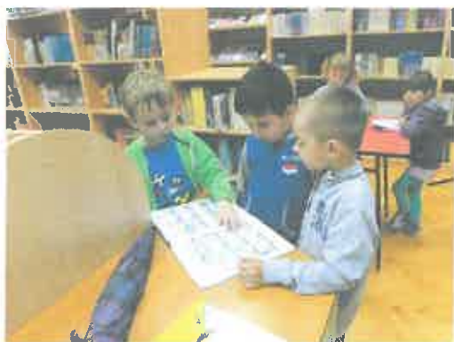
- posjeta školskoj knjižnici