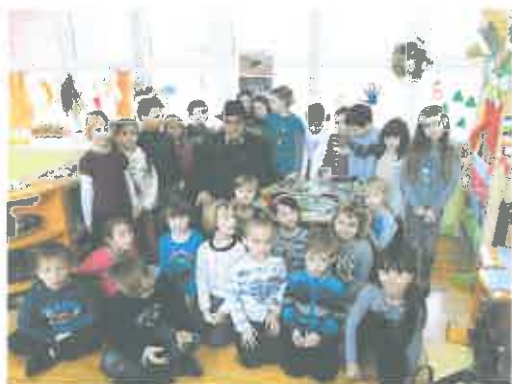
- lovac u posjeti vrtiću