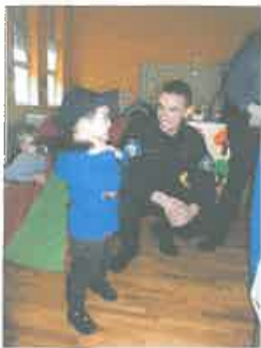
- posjeta policijskog službenika intrventne policije