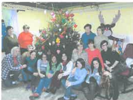
- izrada božićnih ukrasa sa društvom „Maska“