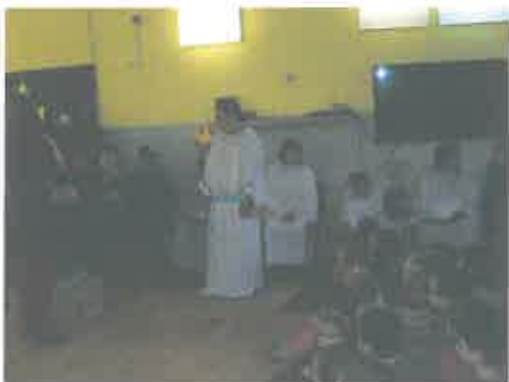
- udruga „Sunce” i njihova Božićna predstava