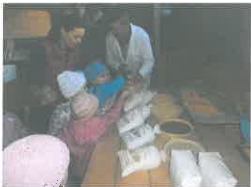
- posjeta Friščićevoj mlinu povodom Dana kruha

Povodom Dječjeg tjedna djeca su posjetila dvorac Trakošćan i imanje Podsečki. Kako bi se što bolje pripremili za predstavljanje našeg kraja na Danima Europe, putovali su putevima starih zanata. Poseban doživljaj bio im je posjeta Domu sportova u Zagrebu gdje su uživali u ledenoj bajci Šegrt Hlapić. Također su posjetili i Zoološki vrt te prisustvovali kazališnoj predstavi "Ja i mali medo" u zagrebačkom kazalištu "Žar ptica".