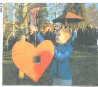
A kaj su mi ostavili tičeki?