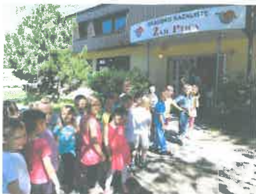
- posjeta dječjem kazalištu „Žar ptica” u Zagrebu