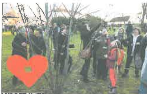
Zebice su naročito razveselile članove Udruge osobe s mentalnom retardacijom Ivanečko sunce