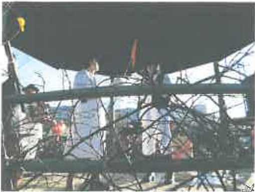
- nastup djece vrtića povodom Valentinovog, a u suradnji s udrugom udomitelja „Nada“.