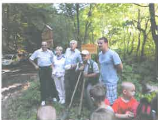
- posjetio nas je i pisac Mladen Kušec