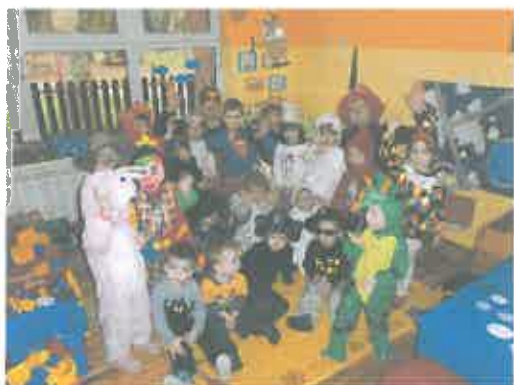
- maškare u vrtiću