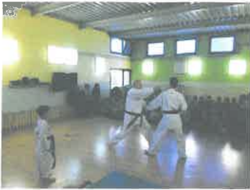
- posjeta ivanečkog karate kluba našem vrtiću