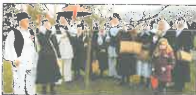
Zov starih običaja – Maska sa ptičjoj svadbi pridružila fuškanjem

Zabavljajući lijepom vremenom, zebice ipak nije ničko zadržalo, a gotovo istuđu ljepo zapaljenih malenih pokloniča su zabim kolačicama, s poljajim