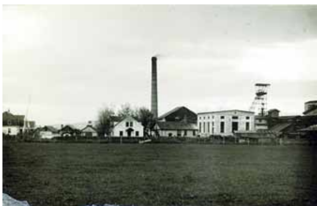
Ivanečki rudnik – 1932. godine

U nešto povoljnijoj ekonomskoj situaciji bili su Ivančani zaposleni u ivanečkim rudnicima koji su, usprkos teškim radnim uvjetima i najnižim dnevnicama u Hrvatskoj, imali ipak redoviti novčani prihod uz još neke pogodnosti koje seljaci nisu uživali. Rudari su uglavnom bili radnici – seljaci i najčešće su povremeno bili zaposleni radi sezonskog karaktera rudnika, a prihodima