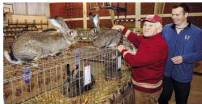
Prije izlaska pred suce, uzgajivači kuniće podvrgavaju pravom tretmanu ljepote