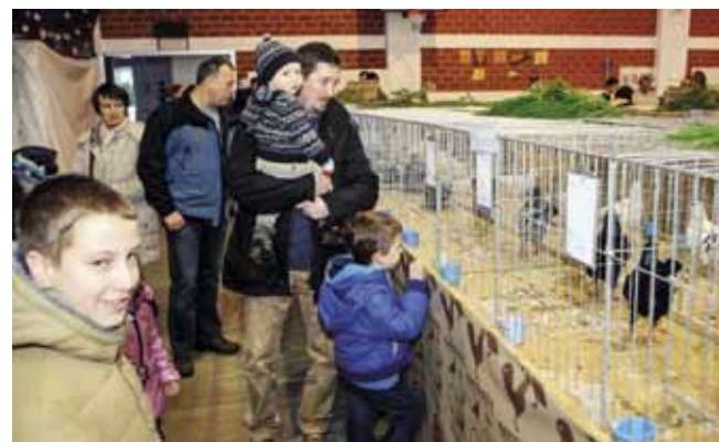
Razgledavanje izložbe lijep je doživljaj za male i velike