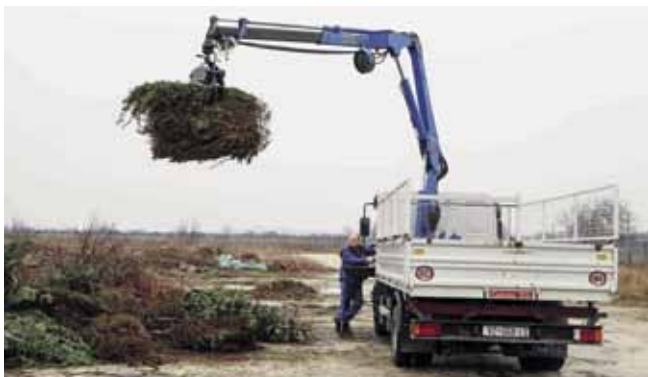
Lani nabavljeno vozilo za zbrinjavanje biooptada vrijedno je 220.000 kuna

Obavljaju se i pripreme za asfaltiranje prostora budućeg reciklažnog dvorišta, a s Gradom i Fondom u tijeku su dogovori za nabavu mosne vage nosivosti 30 tona, za izvođenje elektroinstalaterskih radova te za postavljanje solarnih panela na zgradu u krugu odlagališta. Cilj je urediti