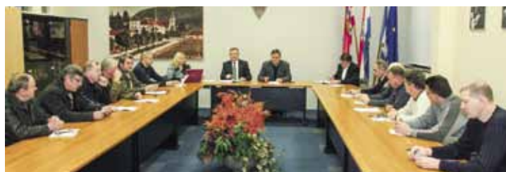
Sastanak u Gradskoj vijećnici s predstavnicima mjesnih odbora

s raspoloživim sredstvima prikupljenim od naplate grobne naknade (koja se nije mijenjala od 2002. godine), prodaje grobnih mjesta i od suglasnosti za građevinske i klesarske radove, sve zajedno oko 250.000 kuna, uključujući i troškove Uprave groblja od oko 37.000 kuna.