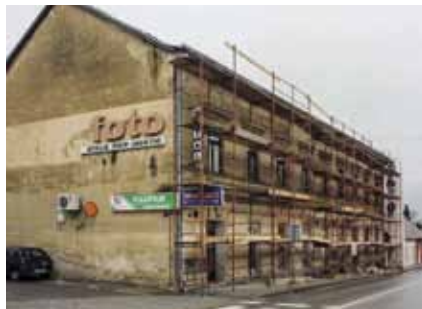
U posao komunalnog redara ulazi i upozoravanje vlasnika objekata na obvezu uređenja pročelja zgrada

Temeljem ovog Zakona, Upravni odjel za urbanizam, komunalne poslove i zaštitu okoliša Grada Ivanca obavlja nadzor u vezi s građenjem i izvođenjem radova koji se izvode na temelju rješenja koja se donose na osnovu propisa kojima se uređuje komunalno gospodarstvo (Zakon o komunalnom gospodarstvu) te nad onima koji se izvode