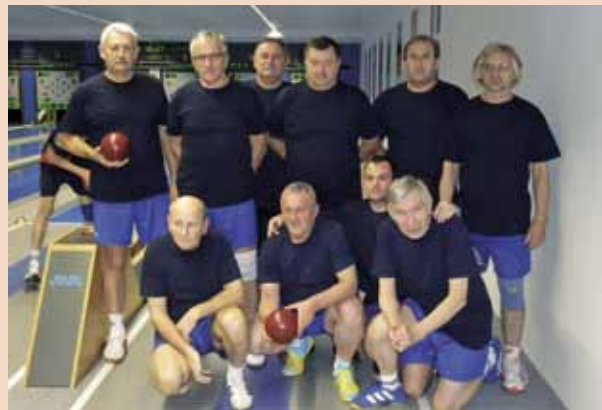
U polufinalu su Varaždincima pružili žestok otpor