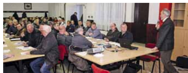
I u Radovanu u velikom su se broju uključili u izobrazbu

Grad Ivanec svim će građanima – polaznicima programa izobrazbe za održivu uporabu pesticida koje provodi Pučko otvoreno učilište Ivanec, edukaciju sufinancirati sa 100 kuna. Tu će subvenciju moći ostvariti samo polaznici s administrativnog područja grada Ivanca. Na taj način Grad će našim građanima barem djelomično olakšati plaćanje edukacije koja je, kao što je poznato, obavezna za sve one koji koriste pesticide. A to su ratari, vinogradari, voćari, povrtlari i drugi, jer bez iskaznice o osposobljavanju više neće moći zaštitna sredstva kupiti u poljoprivrednim ljekarnama. Na području našega grada edukaciju je dosad uspješno završilo 135 polaznika u Ivancu i 75 u Radovanu. Edukacije će se provoditi i u Salinovcu i Stažnjecima te ponovno u Ivancu i Radovanu u veljači. (ljr)