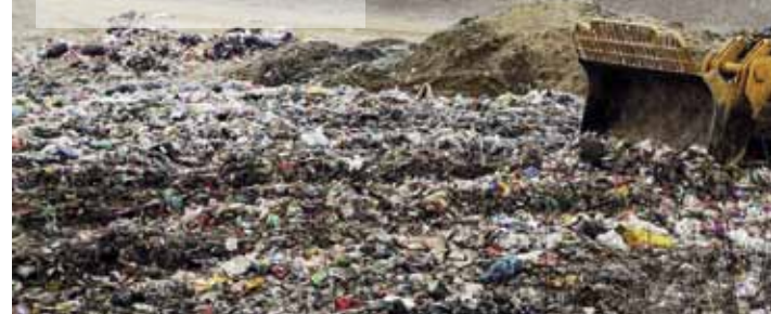
Sanacija deponija u Jerovcu jedan je od najvrednijih takvih zahvata na području sjeverne Hrvatske

Grad Ivanec putem Skupštine poslovanje Ivkoma usmjerava na način da mu primarni cilj ne bude profit, već što kvalitetnije zadovoljavanje komunalnih potreba građana