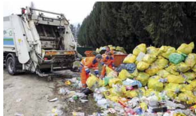
U mjesec dana u Ivkomovu dvorištu prikupi se oko 2,5 tone PET ambalaže, koju potom odvozi Čistoća

metal, staklo, plastiku, tekstil te krupni komunalni otpad. Uz simboličnu naknadu, kod nas mogu zbrinuti i biootpad. Zahvaljujući tome, kontinuirano se povećavaju količine otpada koji završavaju u reciklaži, dok se količine smeća na odlagalištu u Jerovcu smanjuju – ističe izvršni direktor Ivkoma d.d. Mladen Stanko.