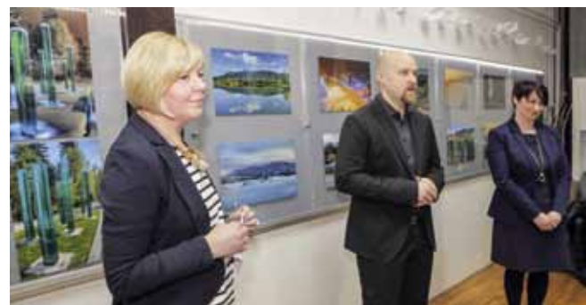
Ivanečki kontrasti – kaleidoskop boja u fotoobjektivu Z. Stanka

Inače, magistar politologije po struci, Z. Stanko fotografijom