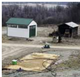
U tijeku su pripreme za uređenje reciklažnog dvorišta, za izvođenje elektroinstalaterskih radova i za postavljanje solarnih panela na zgradu