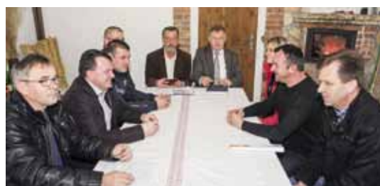
O radovima na groblju Margečan sudionici su razgovarali u ugodnom ambijentu vodenice

sugestije za daljnje aktivnosti i radove na groblju.