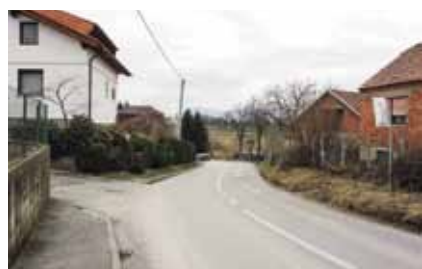
Ove godine nastavlja se gradnja nogostupa u Jerovcu

Nadalje, 1,26 milijuna kuna namijenjeno je gradnji i rekonstrukciji prometnica i nogostupa. Iz niza predviđenih zahvata izdvajamo gradnju nogostupa u Jerovcu, pripreme radnje za gradnju nogostupa Ivanec-Jerovec, gradnju prometnica u Zoni C-3 u Ivancu (Gačeva i Preradovićeve), spuštanje rubnjaka