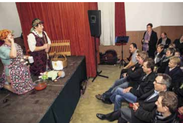
Stožnjevečka kulturna manifestacija ove je godine obilježila svoj petogodišnji jubilej

proslavila svoj prvi, petogodišnji jubilej, gradonačelnik je najavio i ovogodišnje radove na energetske obnovi stare škole u Stažnjecvu, što će rezultirati njenim preuređenjem u modern društveni dom. A to znači da su ovogodišnji Dani glume zadnji put organizirani u dotraja-