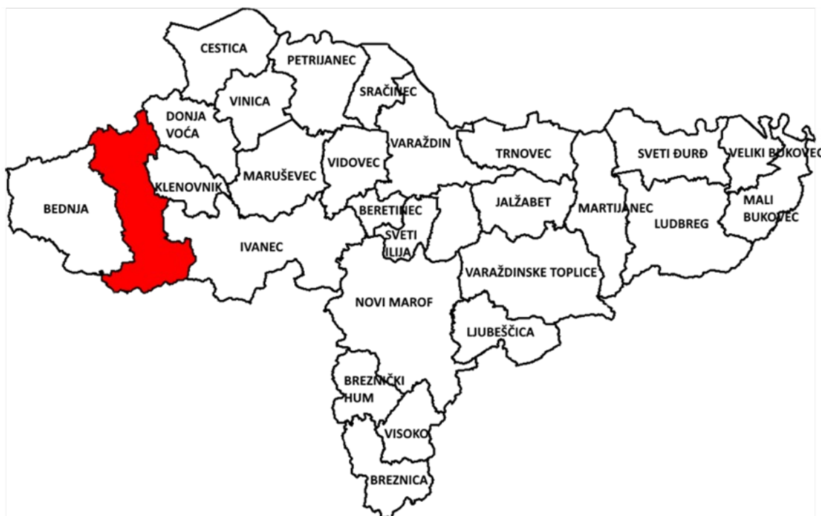
Slika 1. Geografski položaj Grada Lepoglave u Varaždinskoj županiji