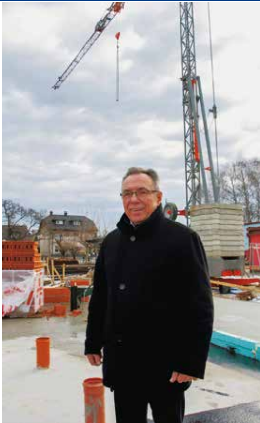
I ove godine novi razvojni skok Ivanca

Potvrda je to da Grad Ivanec s pažnjom dobrog gospodarstva upravlja sredstvima koja mu uplaćujete u pro-