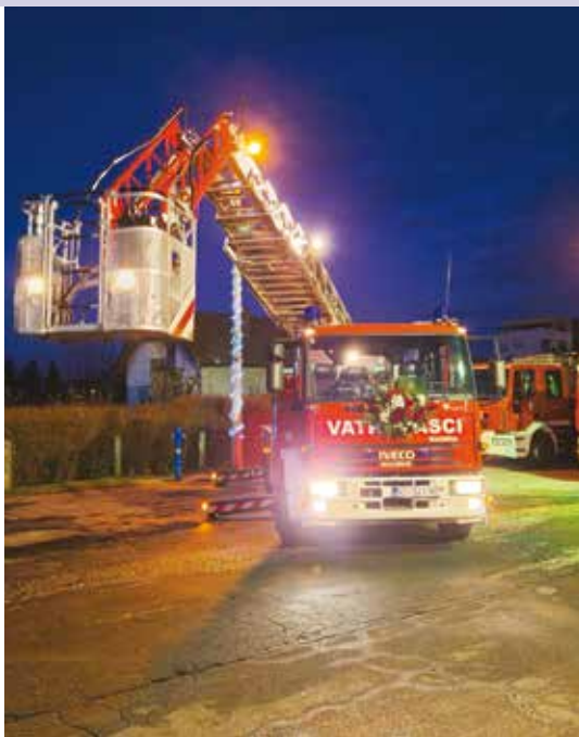
Grad osigurava sredstva za pojačano opremanje DVD-ova i civilne zaštite

Što ako Gradsko vijeće ne donese proračun do kraja tekuće godine za iduću godinu?