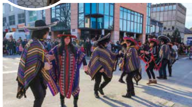
Pončo i sombrero! Stigli i Meksikanci!

tako jadan Fašnik i ove godine glavom platilo za sve nedaće. Ivonjski fašink novčano je podržao pokrovitelj, Grad Ivanec, a kao supokrovitelj pridružila se i gradska Turistička zajednica. (aj,ljr)