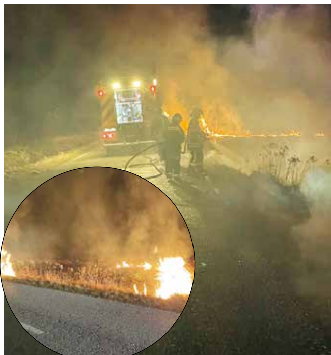
Požar kod spaljivanja može se dogoditi i vama i zato – oprez!

Poljoprivredni redar kontroliira da li vlasnici/korisnici čiste i održavaju svoje poljoprivredno zemljište, izdaje rješenja građanima s nalogom da urede zapuštene površine, a može izreći i