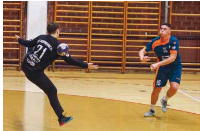
Ivanečki rukometaši u nastavku prvenstva