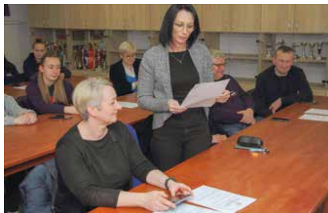
Prihvaćena su sva izvješća za 2023. te planovi za 2024.