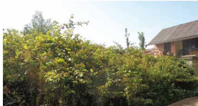
Obveza svakog vlasnika/korisnika jest redovito održavanje okućnice i košnja trave i raslinja

VEGETACIJA VEĆ „KRENULA“ Obavijest komunalnog redarstva vlasnicima i korisnicima građevina i okućnica