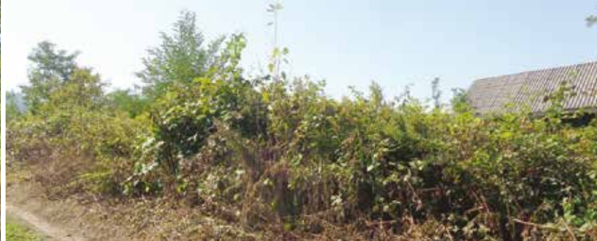
Čistite redovito poljoprivredne površine, ne dopustite da zarastu u šikaru i drač

Stoga i ove sezone apeliramo na sve vlasnike poljoprivrednih površina da ih redovito čiste, a naročito da poštuju naloge koji im stižu iz poljoprivrednog redarstva, kako se ne bi moralo prići sankcioniranju, a to je ono najnepopularnije, što nitko ne želi.