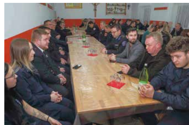
Brojni članovi, gosti i uzvanici na skupštini DVD-a Gačice