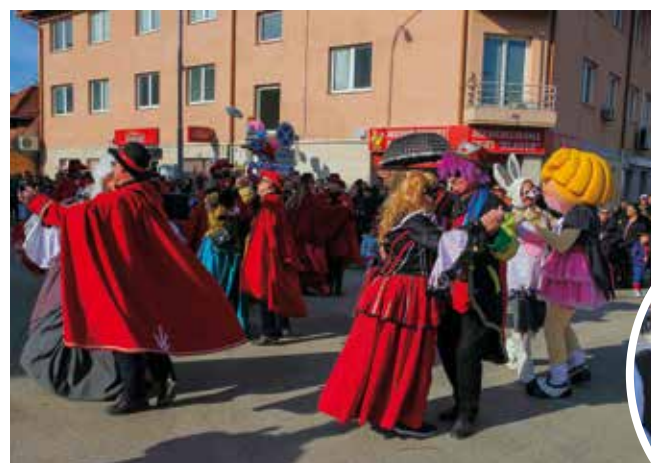
Kad se udari briga na veselje...