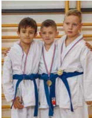
U sportskom duhu

U ime Grada Ivanca, sve natjecatelje, njihove trenere i roditelje,