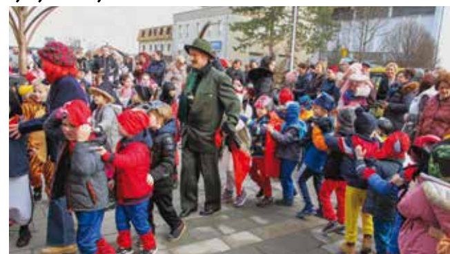
Prekrasna uspomena iz djetinjstva za neke buduće dane

IVANEČKA LIPA Grad Ivanec nastavlja s projektom kloniranja 600 godina stare lipa