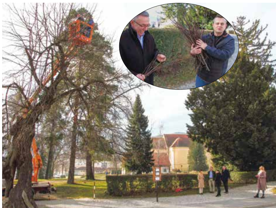
I ove godine nastavlja se s kloniranjem stare lipa na ulazu u gradski park

Zbog velikog interesa građana za sadnju lipa, Grad s ovim projektom nastavlja i dalje te u svom proračunu osigurava sredstva potrebna za njegovu provedbu i ujedno, za trajno čuvanje stabla koje „pamti“ dolazak vitezova ivanovaca na naše prostore. (ljr)