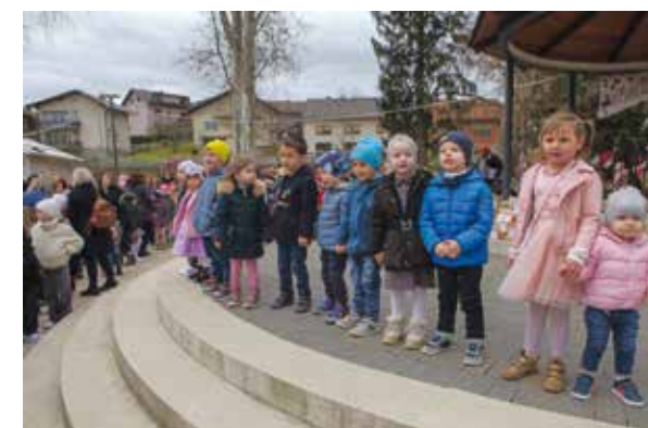
Ovo je pravo svatovsko veselje!

Manifestaciju su organizirali Udruga Nada i dječji vrtići Ivančice, Bambija i Svijeta mašte, a novčani i logistički podupro ju je Grad Ivanec