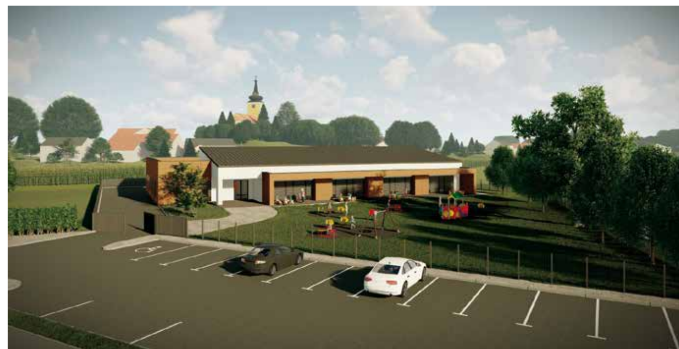
Uvako će izgledati novi gradski dječji vrtić u Radovanu