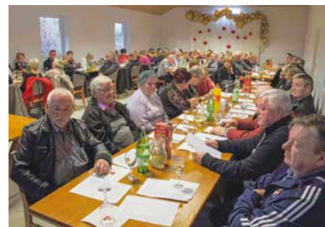
Brojni članovi okupili su se na skupštini Udruge umirovljenika Margečan

Skupštini su nazočili i članovi Skrajskih pajdaša iz Salinovca. Nakon što su okupljeni odslušali predavanje o zaštiti vinove loze, vinogradarsko društvo nastavilo je u neformalnom tonu.(aj)