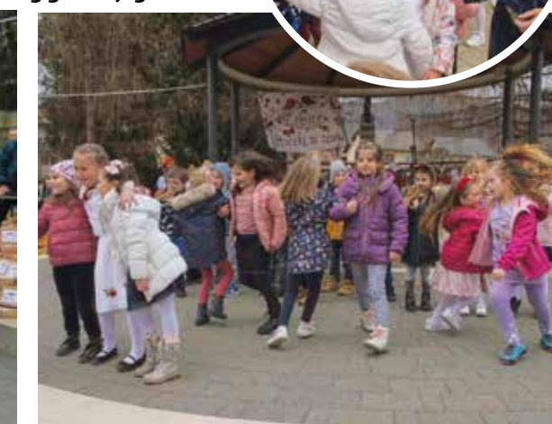
Ovako se pleše i veseli na svadbama!

FESTIVAL DOBRIH EMOCIJA Održani 13. dani glume u Stažnjercu