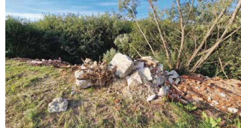
Građevinski otpad u prirodu? Nedopustivo!