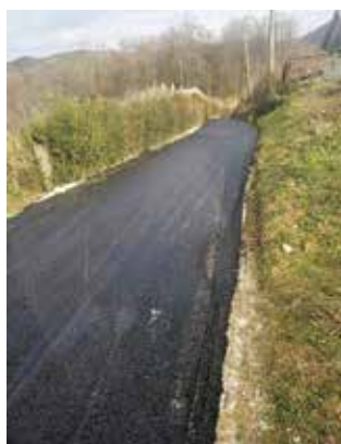
Novouređena strma dionica na Šatornjaku

U 2024. nastavlja se modernizacija nerazvrstanih cesta na širem gradskom području, u što će se usmjeriti 302.000 eura. Predviđeno je uređenje Ulice J. Kraša u Ivancu, prometnice Lančić-Knapić te cesta u Prigorcu, Osečkoj, Gečkovcu, Kaniži, Salinovcu, Lovrečanu i Ribić Bregu. Asfaltirat će se i strme dionice u Knapiću, Ivanečkoj Željeznici, Bedencu, Vitešincu i Škriljevcu. (ljf)