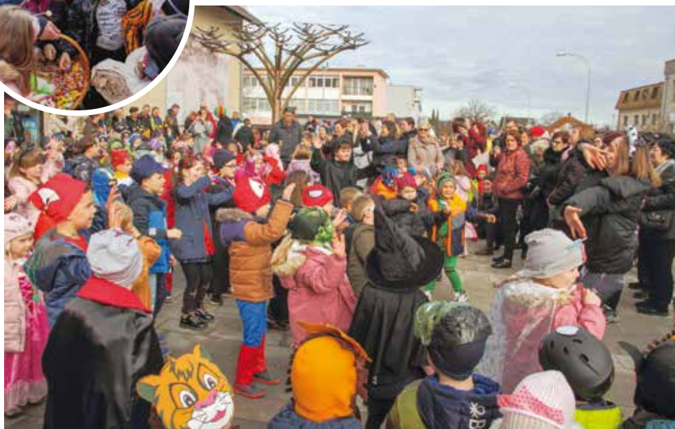
Šareno društvo zaplesalo je na Kinotrgu