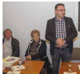
Z. Đuras: Umirovljenici su svijetla točka i temelj zajednice

dovoljstvo pridruživanjem udrugi novih 20-ak članova, a istaknute su i pripreme za sportska