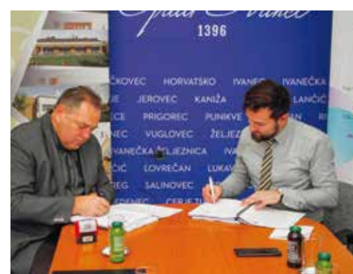
Ugovor o gradnji vrtića je potpisan!