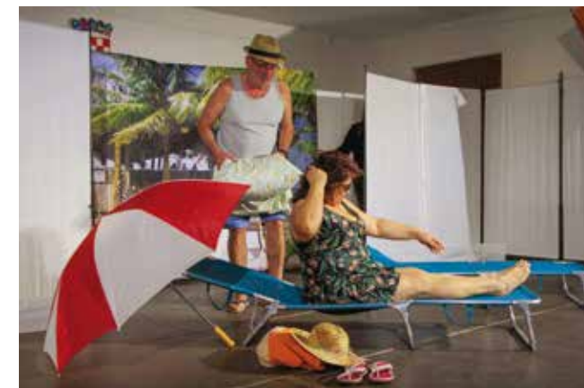
Nepresušne su ideje za zabavne pučke komedije!

Na velikom kulturnom poduhvatu i zahtjevnoj organizaciji manifestacije domaćinima je čestitke uputio gradonačelnik Milorad Batinić. Uz pohvale za promicanje kazališnog amaterizma, što je razmjerno rijetko