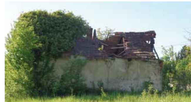
Komunalni redar ima ovlasti postupanja prema Zakonu o građevinskoj inspekciji te narediti uklanjanje ruševine

Zbog nezapamćeno tople veljače vegetacija je već „krenula“, a što su proljetni dani bliži, to će i njeno bujanje biti intenzivnije. Vlasnici okućnica znaju da dolazak proljeća za njih znači otvaranje sezone košnje trave i korova te potkresivanja živica i grmlja. Stoga komunalno redarstvo Grada Ivanca sve vlasnike i korisnike građevina i okućnica i ove godine podsjeća na zakonske odredbe kojima im je propisana obveza održavanja privatnih okućnica i dvorišta poslovnih i stambenih zgrada.