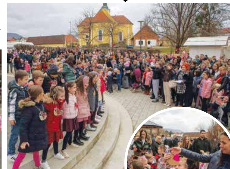
U znaku ljubavi i buđenja novog godišnjeg doba...