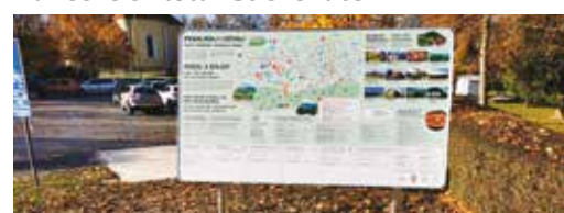
Pedaliraj i uživaj!

VRTIĆ RADOVAN Potpisan ugovor za gradnju novog gradskog dječjeg vrtića u Radovanu