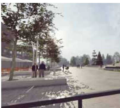
U kojoj su fazi pripreme za zatvaranja gradske špice u pješačku zonu?

– Dakle, ova stvar je isključivo na operaterima, a Grad je odradio ono što može unutar svojih zakonskih okvira. Grad ne može polagati kabele, niti izvoditi priključke. Uputa je da se jave operateru i nađu nekog tko je spreman ići u investiciju. Ne vidim zašto ne bi, jer tu je puno kuća i priključaka i mislim da bi svakom operateru to bilo financijski isplativo – istaknuo je Friščić.