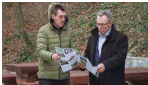
Tiskana je sklopiva karta, vodič kroz 80 km ivanečke cikloturističke rute

–S uređenjem cikloturističkih punktova nastavljamo i dalje, a u planu je postavljanje novih kod etno kuće Bedenec, kod vodenice u Margečanu, na vrhu Ivančice, kod hotela Orion te u Salinov-