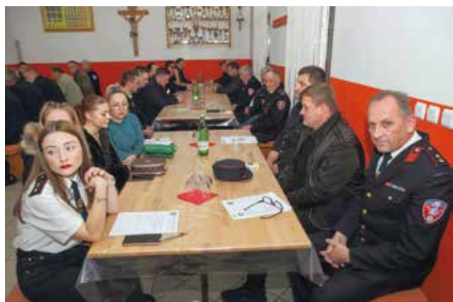
U 2024. nastavak rada s mladima, želja – novo navalno vozilo

UDRUGA UMIROVLJENIKA MARGEČAN Održana godišnja skupština