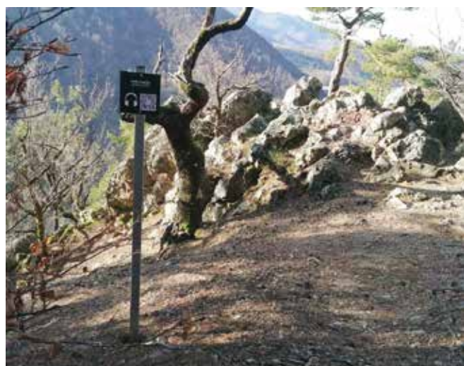
Audio vodič na Vražjem stolčku

i svim ostalim izletnicima, a bit će opremljena stolom i klupama te solarnim servisnim stupom s alatom za popravak bicikla, identičnom onome u Ivancu. Po-