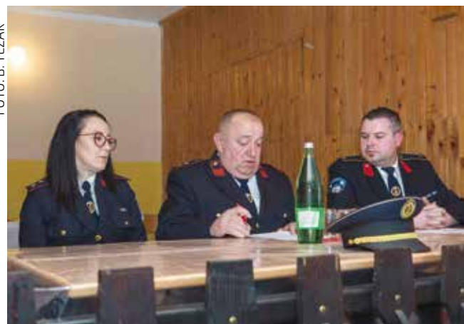
DVD je pokretač mjesnog društvenog života