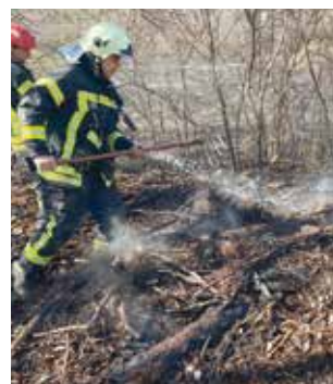
Gašenje požara na otvorenom u pravilu iziskuje veći broj vatrogasaca i specijalnih vozila

Ukoliko se izvidom od strane DVD-a utvrdi da vlasnik parcele iz opravdanih razloga nije u mogućnosti sam osigurati preventivne mjere, spaljivanje će odraditi DVD. Trošak spaljivanja snosi vlasnik parcele.