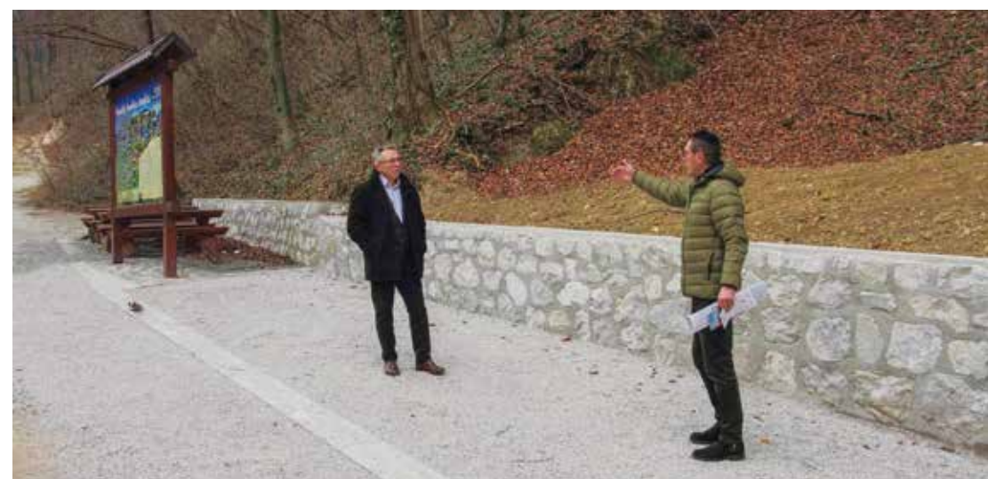
Na Žganom vinu sagrađena je škarpa i podloga za postavljanje biciklističke nadstrešnice

kraj nadstrešnice bit će postavljene rampe za bicikle te dvostrana interpretacijska ploča. Radove izvodi Ivkom d.d. Ivanec – poručio je B. Jagetić Daraboš.