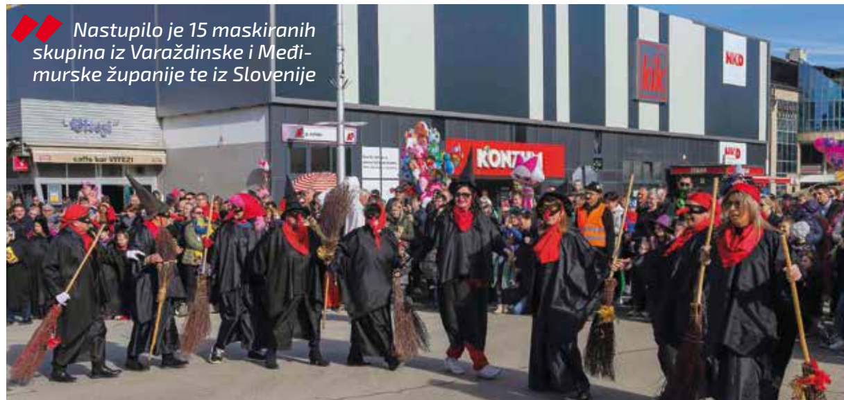
Coprički ples ivanečkih Maski

Nastupilo je 15 maskiranih skupina iz Varaždinske i Međimurske županije te iz Slovenije