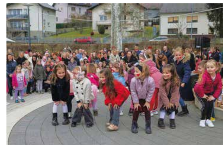
Mnoštvo velikih i malih svatova na Ptičjoj ženidbi