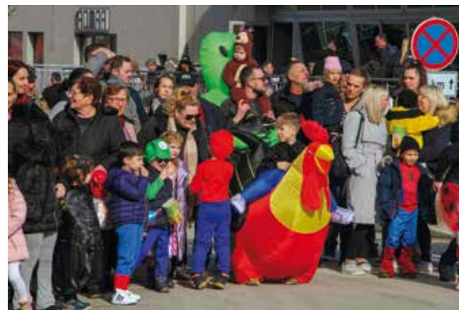
Veselje velikih i malih