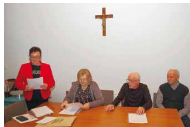
Razlog za optimizam – sve više novih članova

Iza margečanskih umirovljenika godina je u kojoj su obilježili 15 godina rada. Među pozitivnim trendovima je povećanje broja članova, niz uspjeha na raznim natjecanjima, pomoć potrebitima, redovito održavanje sastanka, čišćenje okoliša... Održani su i dani otvorenih vrata kod vodenice u Margečanu, a članovi su se družili na izletima te na raznim manifestacijama i blag-