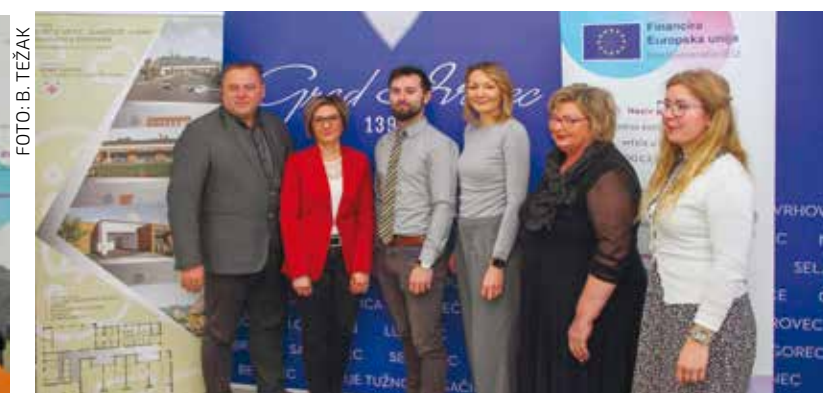
A sada – radovi mogu početi!