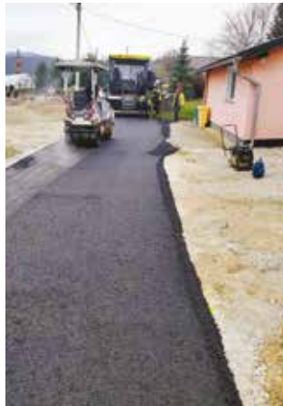
Asfaltiranje u Lovrečanu