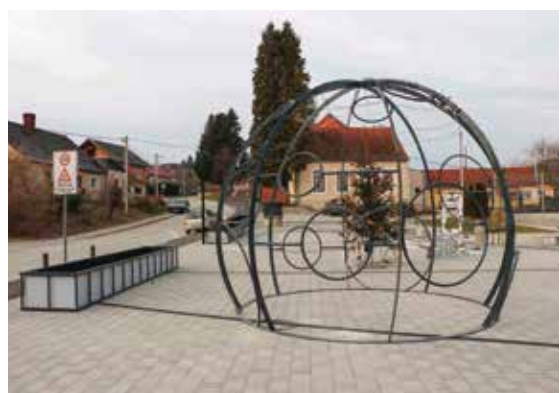
Trg u Margečanu – paviljon još nije opleten šibom

Vijećnici su donijeli i odluku o prihvatanju ponude za prodaju jedne nekretnine u vlasništvu Grada Ivanca (pašnjaka) za 10.500 eura te prihvatili izvješće o korištenju sredstava proračunske zalihe za 2023. godinu.