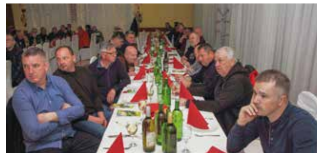
Brojno članstvo i gosti na skupštini Udruge Peharček Ivanec