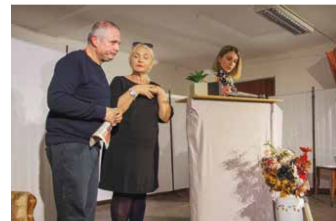
Komedijaši u novoj predstavi Ispod marelice