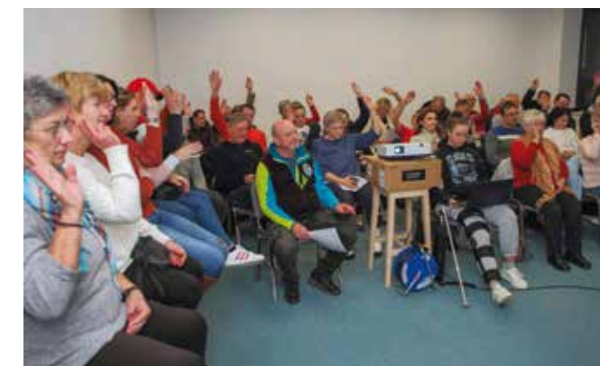
Planinari i njihovi gosti na godišnjoj skupštini PK Ivanec

Skupštini PK Ivanec nazočili su i predstavnici UDVR-a Ivanec te prijateljskog PD-a Ljutomer iz Slovenije.(aj)